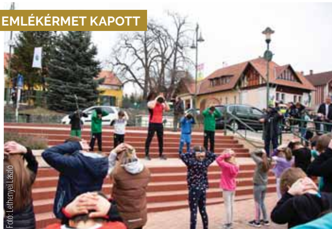
Dr. Kiss Gergely olimpiai bajnok vízilabdázó tartotta ismét a bemelegítést