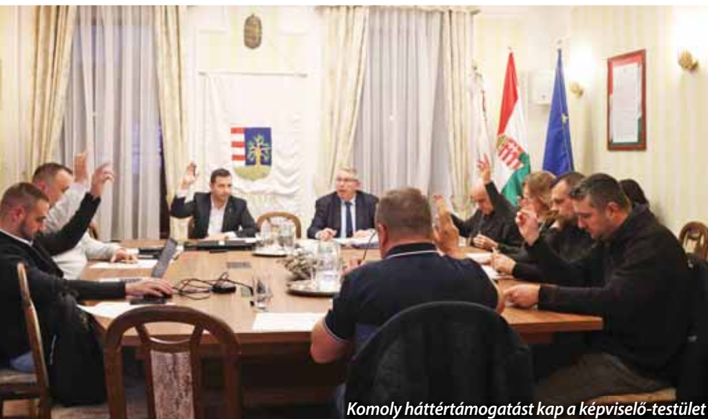
Komoly háttértámogatást kap a képviselő-testület

Ugyancsak terven felüli, de már extra mértékű évközi túlterhelésként hárult a hivatalra a több ezer szelektív hulladékgyűjtő edény egyszeri beszerzési ügyviteli folyamatának koordinálása, továbbá az energiaárak növekedése és a közüzemi szol-