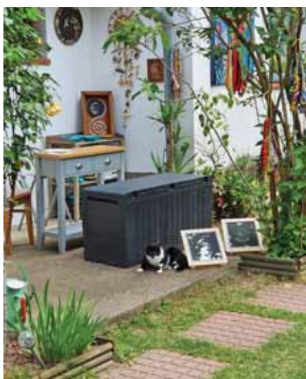
Népszerű volt a Nyitott kapuk fesztivál

A szadai képviselő-testület az év elején hirdette meg a 10 millió forint keretösszegű civil keretre szóló pályázatát, amelyre regisztrált helyi civil szervezetek, alapítványok, egyházi szervezetek, magánszemélyek adhatták be kérelmeiket. A 2023-as nyertes pályázatokat ismertetjük.