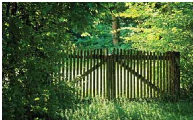
Gyakran telekinformációk miatt keresik a műszaki osztályt

Közjegyző előtt tehetünk végrendeletet, kérhetjük an-