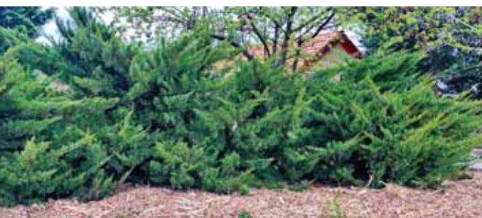
A fadarálékot mulcsozásra használják fel