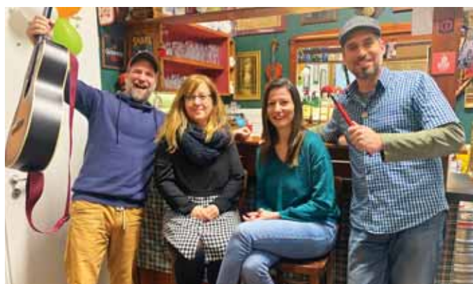
Spontán fejlődik a szadai zenekar

Mint mondta, a próbahely mindig a pub volt, és egy ilyen gyakorlás alkalmával a törzsvendégek körében felvetette, hogy nincs-e kedve közülük valakinek elénekelni az ír népdalokat – lett. Aztán azt is megkérdezte, nincs-e kedve másoknak is csatlakozniuk egy kórushoz – volt. Így már össze is állt a háromfős hölgykórus. Formálódott tehát egy ír népdalokat és zenéket előadó társaság, majd felmerült bennük, hogy igazodva Írország nemzeti ünnepéhez, a Szent Patrik-naphoz, minden év március 17-én tartsanak egy bulit a Kazooban.