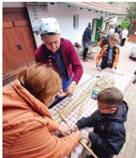
Tájházi programok is várhatók