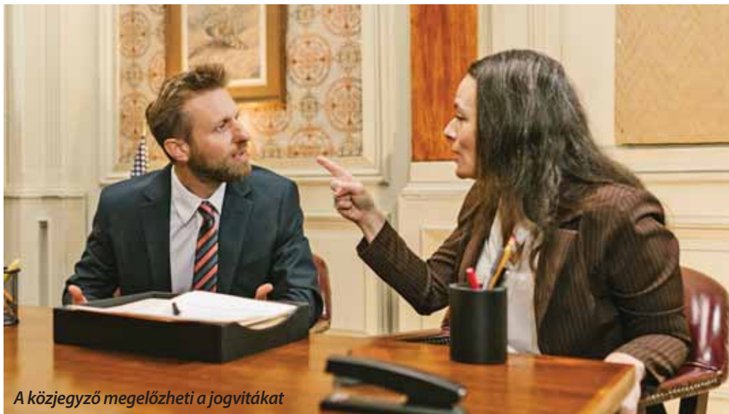
A közjegyző megelőzheti a jogvitákat