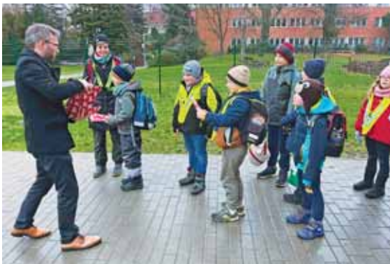
A sétával motiválják is a gyerekeket