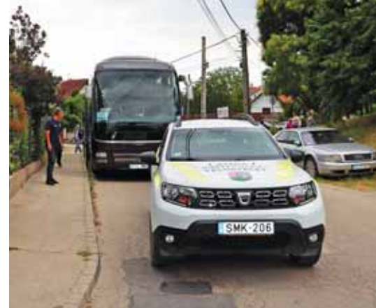
Hatékony a helyi közterület-felügyelet is

A módszeres alaposággal végzett jogharmonizációs tevékenység eredményeként a képviselő-testület 2022-ben már csaknem hiánytalanul felszámolta a kodifikációs munka korábbi ciklusokból örökölt hiányosságait. Csupán egyetlen rendelet pótlásának feladata húzódott át 2023-ra: a települési környezet védelméről szóló önkormányzati rendelet megalkotását a testület az áprilisi ülésre irányozta elő, ugyanis be kellett várni hozzá a környezetvédelmi program tervezeté-