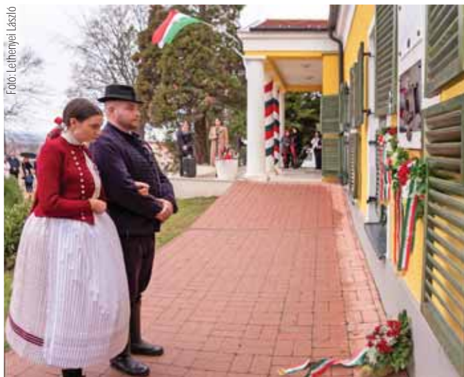
Valamennyi helyi intézmény, szervezet koszorúzott