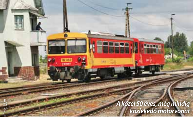
A közel 50 éves, még mindig közlekedő motorvonat

Ehelyett most a miniszter napi két-három vonatra vonatkozó »jogot« ígért, miközben az ország nagy részén jelenleg – még – óránkénti-kétóránkénti ütemes közlekedés van. Lázár János