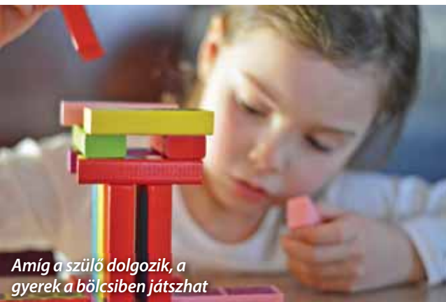
Amíg a szülő dolgozik, a gyerek a bölcsőben játszhat

A Magyar Államkincstár (MÁK) szeptember 2-től újra vissza nem térítendő támogatást nyújt a kisgyermeket nevelő szülők munkaerőpiaci visszatérésének támogatása céljából. Ez a korábbi „GINOP-pályázat” néven futott bölcsődei támogatás folytatása, megváltozott feltételekkel.