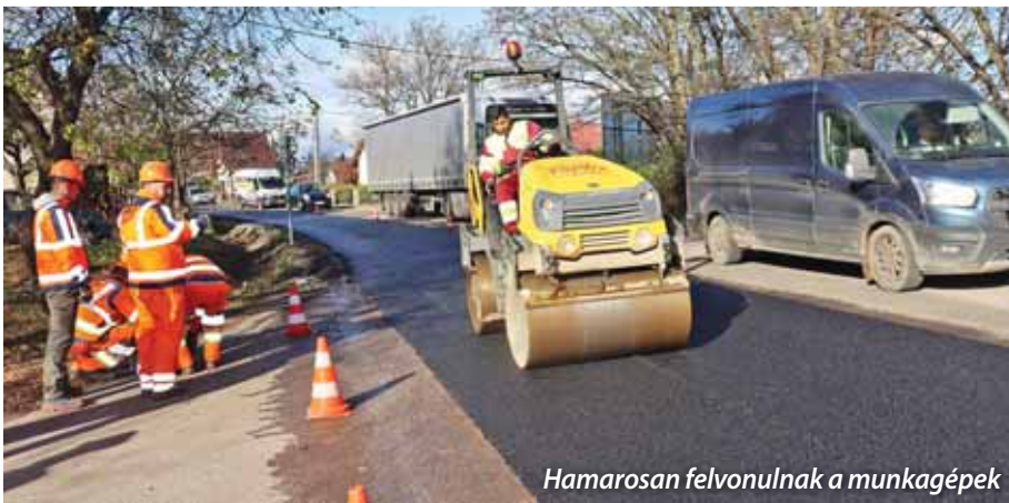
Hamarosan felvonulnak a munkagépek

Szada Nagyközség Önkormányzatának képviselő-testülete 2024. augusztus 15-én rendkívüli ülést tartott, amelyen döntés született többek között arról, hogy biztosítja a Dózsa György út további felújításához szükséges gépparkot és az ahhoz kapcsolódó szolgáltatásokat.