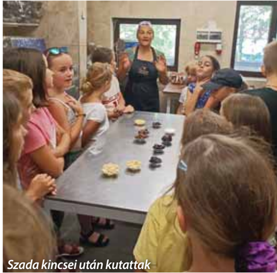
Szada kincsei után kutattak