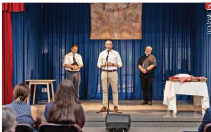
Az egyházak képviselői is megáldották az új kenyeret