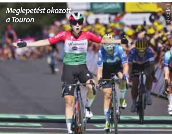
Meglepetést okozott a Touron