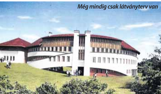
Még mindig csak látványterv van

Bár minden szempontból nagy szükség lenne az új szadai iskolaépületre, egyelőre csak szükségmegoldásokkal enyhítik a helyhiányt. Sajnos érdemi válasz nincs a legfontosabb kérdésre.