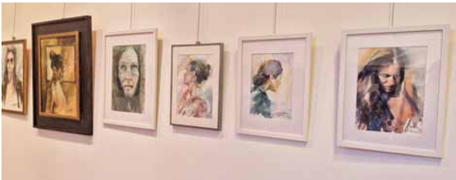
Az érzelemdús női arcoknál érdemes elidőzni