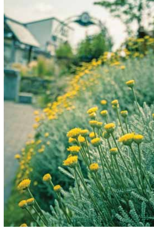
Virágos kertekkel is lehet nevezni

A jelentkezők kertjeit személyesen, előre egyeztetett időpontban látogatják végig a bírálók. Az első látogatást telefonos bejelentkezés előzi meg, ezért fontos, hogy bármely elérhetőségen jelentkezik, ne felejtse el megadni a telefonszámát! A látogatás al-