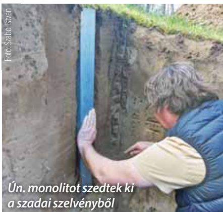
Ún. monolitot szedtek ki a szadai szelvényből

Márciusi lapszámunk megjelenésével egy időben került sor a „TALAJ a talpad alatt” nevű program szadai eseményére, amelynek fontosságát e számunkban ismertettük is. Most röviden összefoglaljuk, mi is történt ezen a napon.