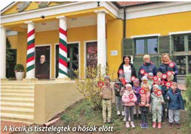
A kicsik is tisztelegtek a hősök előtt

A hosszú, álmos tél után végre elkezdett a tavasz óvodánkba is. Ennek öröme – a tavaly megkezdett hagyományt folytatva – a Manócska csoportosok a Faluház kertjébe egy kis jostabokrot (ribiszkeköszméte) ültettek. A gyerekek az idén is örömmel segédkeztek, tovább öregítve ezzel „Gyümölcs-termő Szent Szada” hírnevét. Március 8-án a nőnap alkalmából a csoportokba járó fiúk virággal kedveskedtek a lányoknak, a polgármesteri hivatal férfi munkatársai pedig minket, óvodai dolgozókat köszöntöttek.