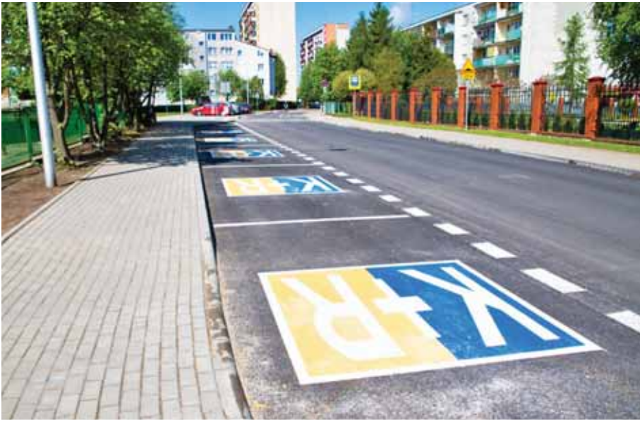
K+R zónákat is alkalmaznak a határon túl

úgy általában azt, mi is történik a reggeleken, amikor mindenki munkába rohanva viszi gyermekét az egyes intézményekhez, majd siet is tovább.