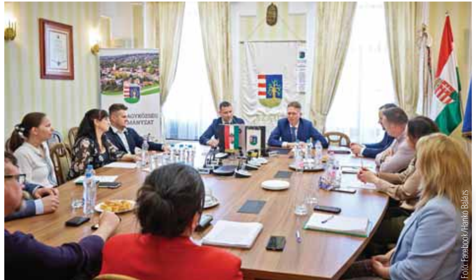
Hankó Balázs (középen, jobbra) széles körben tájékozódott

Hankó Balázs kultuszminiszter politikusként, pártja választókerületi elnökeként látogatott el Szadára, hogy közelebbről is megismerje a helyi közéleti ügyeket.