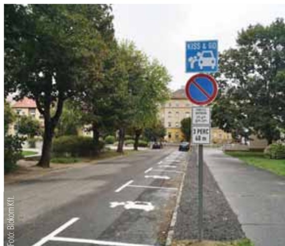
Pécs bevált a gyors parkolási megoldás

Ezeket a szokásokat fokozatosan változtatni szeretnénk. Mint fentebb említettük, figyeltük és mértük a megállási, a ki- és beszállási szokásokat. Voltak családok, akik tökéletes módon, öt másodperc alatt „letudták” az elkészítést és a kiszállást, de voltak, akiknek ez fél percig is eltartott, s közben akadályozták a többi várakozót vagy éppen a központi parkolóhelyre ki- és beálló autókat.