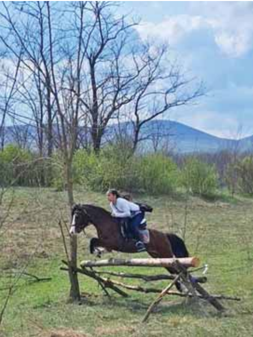
Természetes ugróakadályokat kellett átvinni