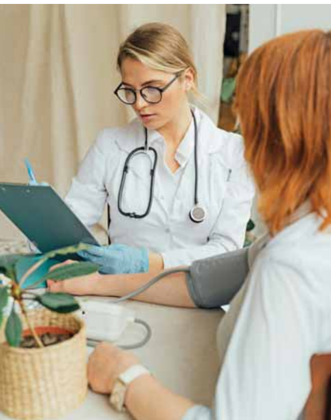
Lesznek az idén is szűrővizsgálatok

A szadai képviselő-testület március 26-i rendes tanácskozásán kiemelten foglalkozott egészségügyi, szociális, gazdasági és építési ügyekkel. Döntöttek az idei díjazottakról is, akiknek kilétére a Székely-napig várni kell.