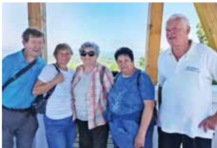
Kellemes kirándulás volt

Gyaloglócsapatunk tagjai szorgalmasan rótták a kilométereket Szadán és a környező településeken, jártak a Várdombon, az Álomhegyi-tónál és Mogyoródon. Utóbbinál