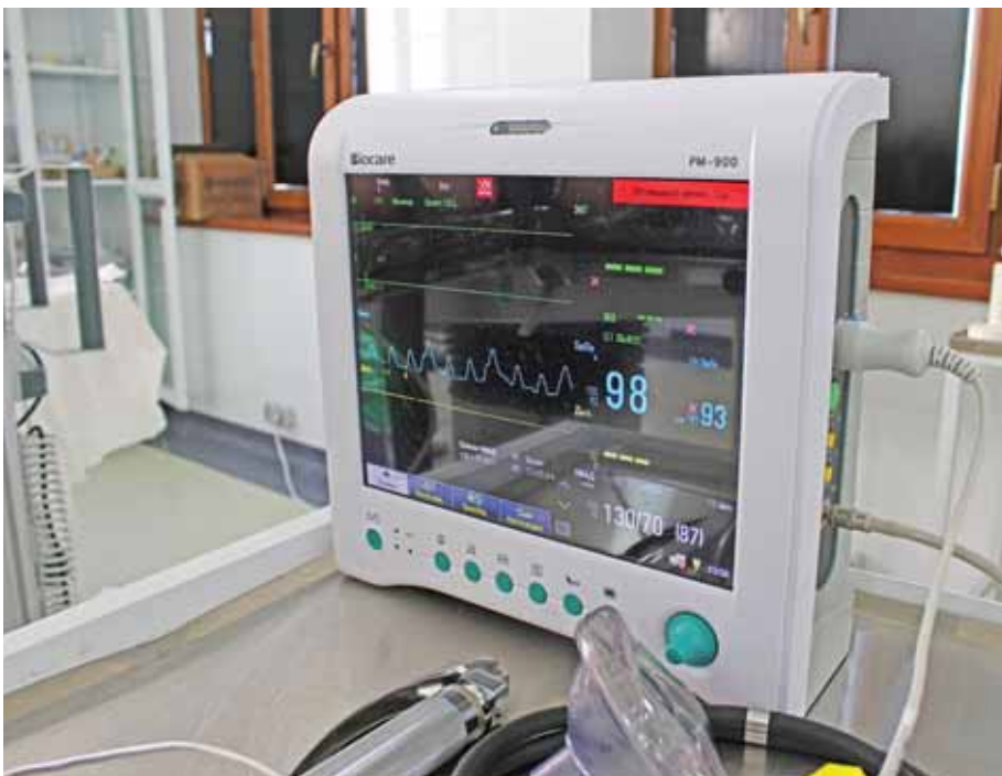
Egy modern eszközökkel felszerelt egészségház megléte a cél

Ezen lapszámunk június 19-én jelent meg, két nappal a fentebb említett június 17-i rendkívüli testületi ülés után. Így mire olvasóink ezt a háttérösszeállítást elolvasták, elképzelhető, hogy új információ is társul már hozzá. A fejleményekről a következő lapszámunkban is beszámolunk. RF