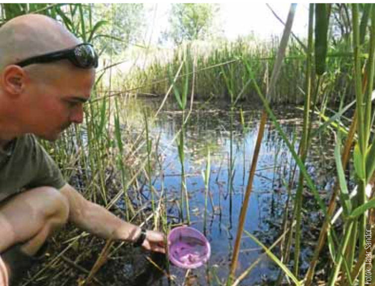
A lápi pócot folyamatosan figyelemmel követik