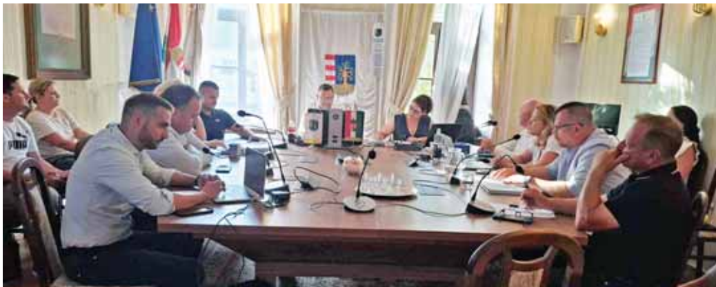
Néhány döntést alaposan meg kellett fontolni

A testület elfogadta a Szada Nova NKft. 2025. évi mérlegbeszámolóját és közhasznúsági jelentését, valamint elfogadta a társaság 2026. évi első negyedévi időszakot érintő beszámolóját is.