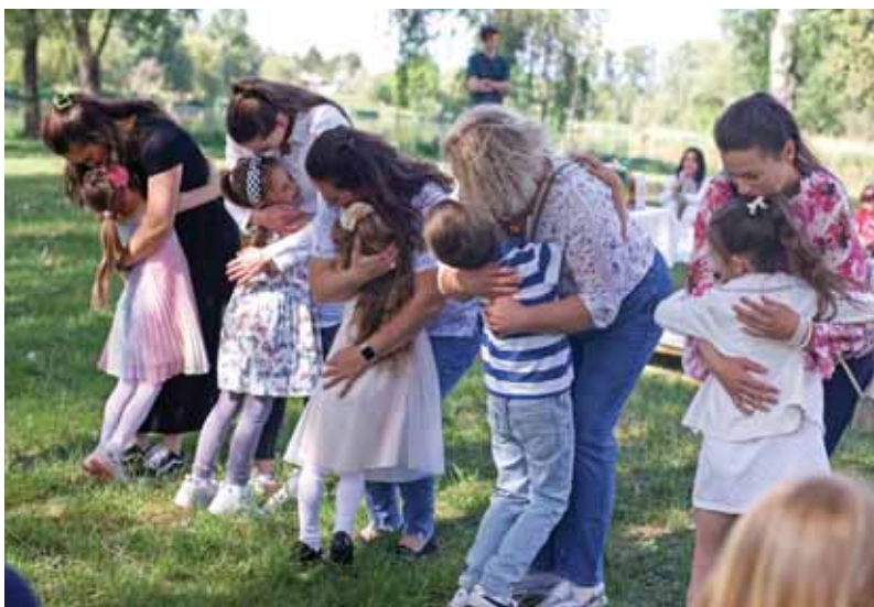
Meghatódtak az édesanyák