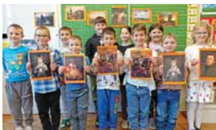
Székely Bertalan emléke él

Az idei tanévben május 12-én tartottuk a Székely-projektnap egyik fontos rendezvényét, a Székely-akadályversenyt. Az időjárás sajnos nem volt kegyes hozzánk, az eső miatt a programot az iskola épületén belül rendeztük meg. A gyerekek négy korcsoportban versenyeztek és hét állomáson adhattak számot Székely Bertalanról szerzett tudásukról. Ügyességi játékok, rajzolás, tesztfeladatok szerepeltek az egyes állomásokon.