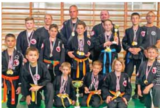
A szadai kempósok verhetetlenek voltak

A házigazda Fehér Tigris SZSE versenyzői kiváló eredményeket értek el. A csapat