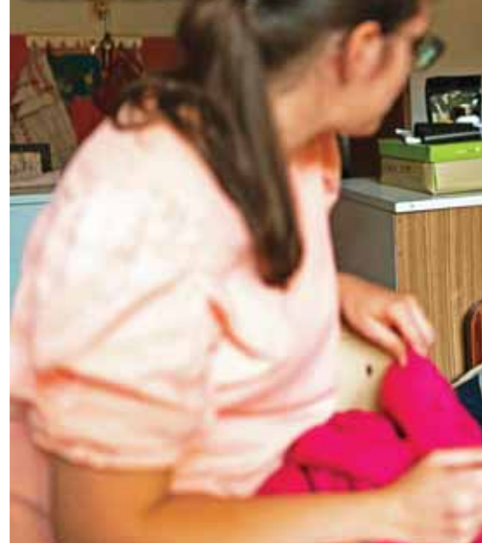
A házi segítségnyújtás kiemelt feladata a SZAK-nak

egyeztetéssel lehet bejutni hozzá. Éppen ezért az én irodám ajtaja állandóan nyitva van, hozzám mindenkor, minden ügygel be lehet jönni. Úgy vagyok vele, ha bárkinek bármilyen problémája adódik, azt én tud-