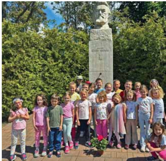
Az ovisok is jelen voltak a Székely-napon

Május 10-e a madarak és fák napja – egy olyan nevezetes nap, amely alkalmat ad arra, hogy a természethez való pozitív viszonyulást alakítsunk ki a gyerekekben. Hisszük, hogy a legjobb tapasztalatszerzés óvodás korban a valódi élmény. Ezért a csoportok többsége séták, kirándulások alkalmával ismerkedett és beszélgetett a fák sokszínűségéről és a madárkáról. Megbeszéltük a gyerekekkel, hogy miért hasznosak a fák. A kicsik többsége már jól tudja, hogy árnyékot és élőhelyet nyújtanak a rovaroknak, madaraknak, mókusoknak, levelekkel tisztítják a levegőt. A Maci, a Katica és Manócska csoportosok elsétáltak egy szadai cseresznyés kertbe, ahol saját maguk szedhették a finom gyümölcsöt, a Méhecske és Nyuszi csoportos gyerekek pedig az óvoda cseresznyefáit dézsmálták nagy örömmel. Jó volt látni az apróságok boldogságát, amikor fára másztak és füllükre akasztották az érett gyümölcsöt.