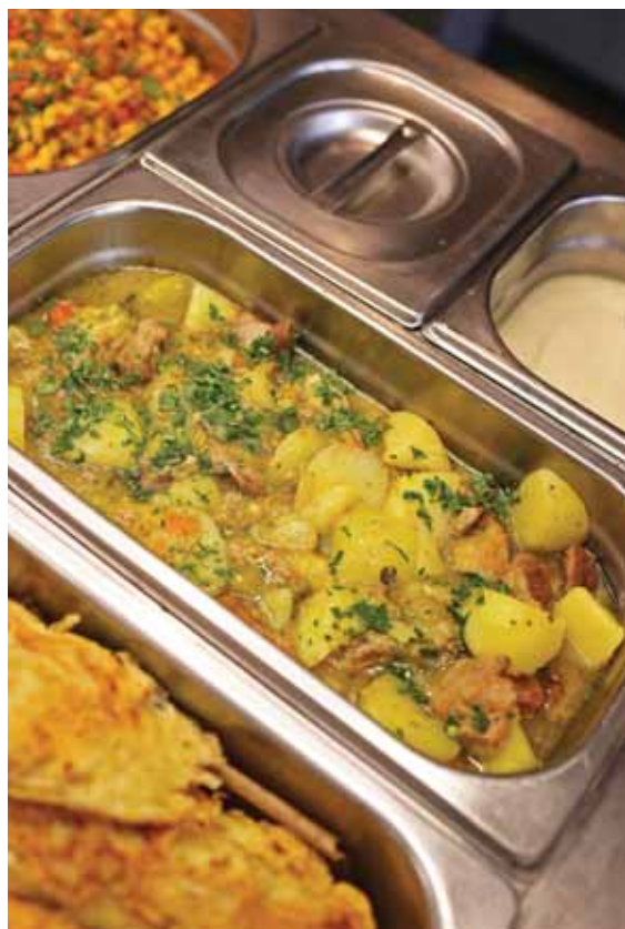
Az új szolgáltató változatosabb ételeket kínálhat

Sokan emlékeznek még arra az időszakra, amikor a helyi konyhák jóval nagyobb szabadsággal működtek. A konyhás nénik személyesen ismerték a helyi igényeket, gyakran helyi termelőktől vagy környékbeli vállalkozásoktól szereztek be az alapanya-