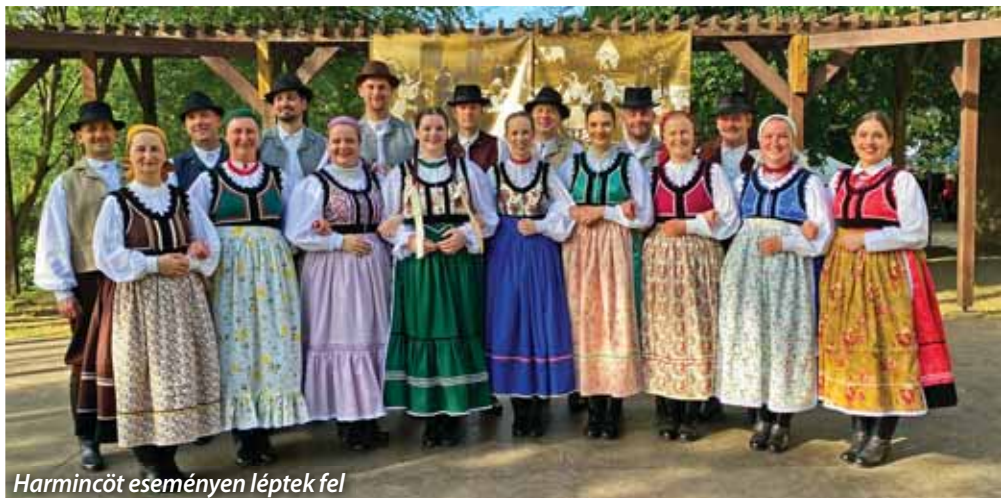
Harmincöt eseményen léptek fel

Az év folyamán az együttes nemcsak Szadán, hanem a környező településeken is megmutatta tehetségét. Így léptek színpadra – lelkes fogadtatás közepette – többek között Püspökszilágyon, Keszegen, Tabon és Veresegyház rendezvényein is. A legkedvesebb fellépések mégis – a szadai rendezvényeken túl – a testvértelepüléseken való szereplés. Az év egyik csúcspontja Szada szicíliai testvérvárosában, Castelbuonóban történt látogatás volt. Az ott lakók megismerhették a magyar néptánc gazdag kincseit, miközben a táncosok is bepillantást nyerhettek a szicíliai kultúrába. Emellett Szada két külhoni testvértelepülésének, az erdélyi Kecset és a kárpátaljai Nagydobrony rendezvényeit is színesítette az együttes. Utóbbinak az együttes tagjai 100 000 forint adományt gyűjtöttek össze a háború okozta károk enyhítésére. A találkozások nem csupán