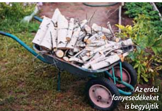
Az erdei fanyesedékeket is begyűjtik

Sajnos ezen háztartások gyakran nem csak fát tüzelnek a kályháikban. Bár nagyon kevesen vallják be expliciten a szemétegetést, mikor a lekérdezés az attitűdre kérdezett rá, jelentős réteg vallotta, hogy nincs baja a szemétegetésével. Ezen adatok alapján mintegy 720 ezerre becsülhető azon háztartások száma, akik nem zárkoznak el a fűtési célú hul-