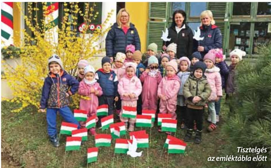
Tisztelgés az emléktábla előtt