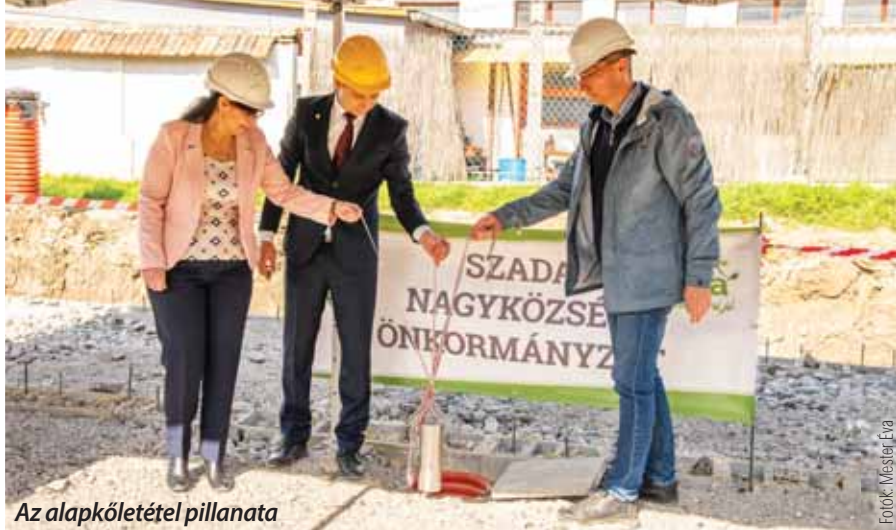
Az alapkőletétel pillanata