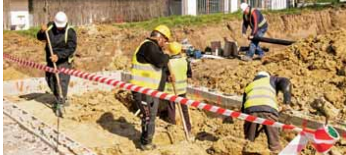
Jól haladnak a munkálatok

– Az óvodában már korábban is kellett élnünk azzal a lehetőséggel, hogy a fenntartó önkormányzat engedélyezze a csoportok törvényben rögzített maximális létszámának (25 fő) 20 százalékkal történő átlépését. De ezzel csak átmenetileg lehetett kezelni a növekedési igényt, szükség volt átgondolni a további lépéseket is. Az önkormányzat már 2021-ben létrehozta az óvodai férőhelyek növelésén dolgozó munkacsoportot, amelynek munkája során több megoldás, így egy új épületrész