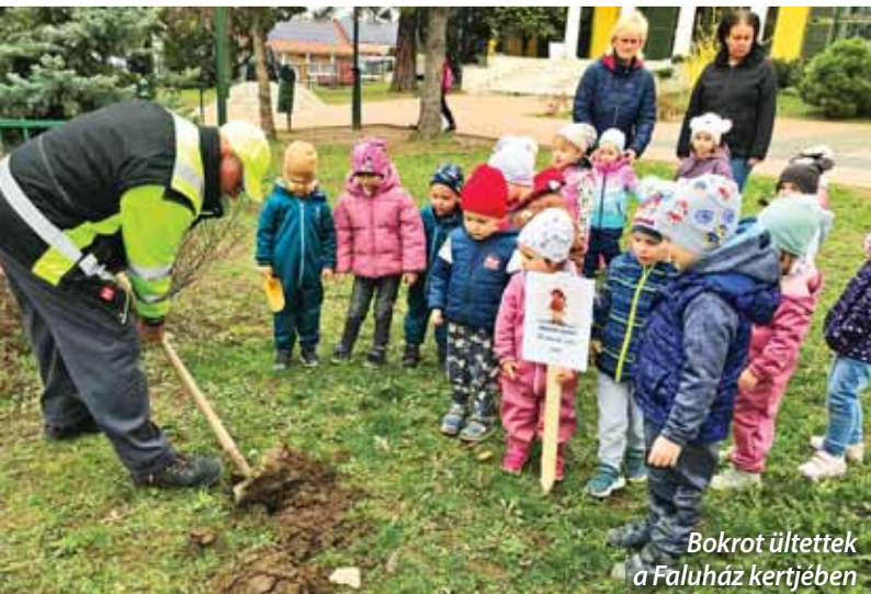
Bokrot ültettek a Faluház kertjében

A március sok, változatos programot hozott a szadai óvodások életébe. Megünnepezték március 15-ét és húsvétot is. De a Víz világnapja is számos meglepetést hozott.