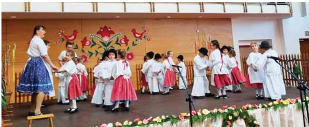
Öt szadai pedagógus vett részt a néphagyományörző óvodák találkozóján

Az óvodai és bölcsődei beiratkozás megtörténte után bizton állíthatjuk, hogy a beruházás szükséges, hiszen a településen óriási az érdeklődés az óvodai, bölcsődei ellátás iránt. A szülők nemcsak az óvodaköteles (a 3. életévüket augusztus 31-ig betöltők), hanem az őszi, téli időszakban harmadik életévüket betöltőket is szép számmal beíratják hozzánk. Egy hónap