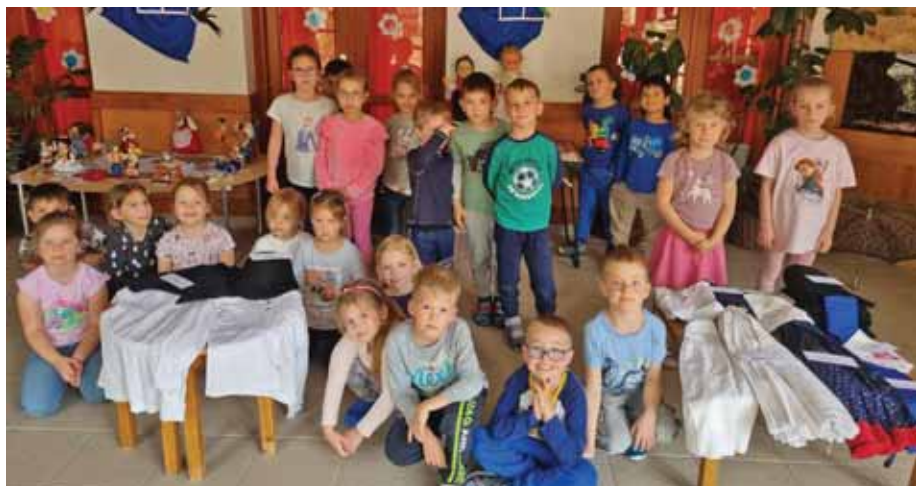
A különböző népi viseletekkel is megismerkedtek