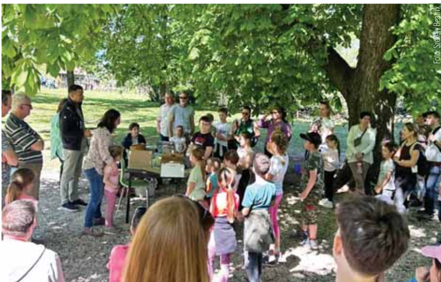
Sokan járták körbe a neves szadai helyszíneket