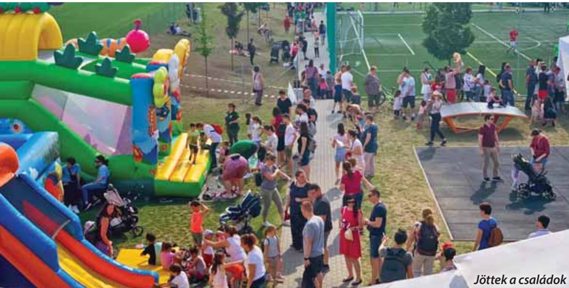
Jöttek a családok

2024. május 4-én került sor a Faluház szervezésében a már hagyományosnak számító Családi nap elnevezésű helyi rendezvényre a Szadai Sportcentrumban.