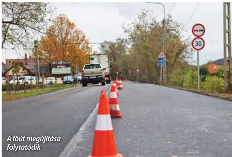
A főút megújítása folytatódik

Mindez azt jelenti, hogy a tavaszra tervezett felújítás 2024 második felére tolódik, de mindenképpen megvalósul még az aktuális önkormányzati ciklusban. AP