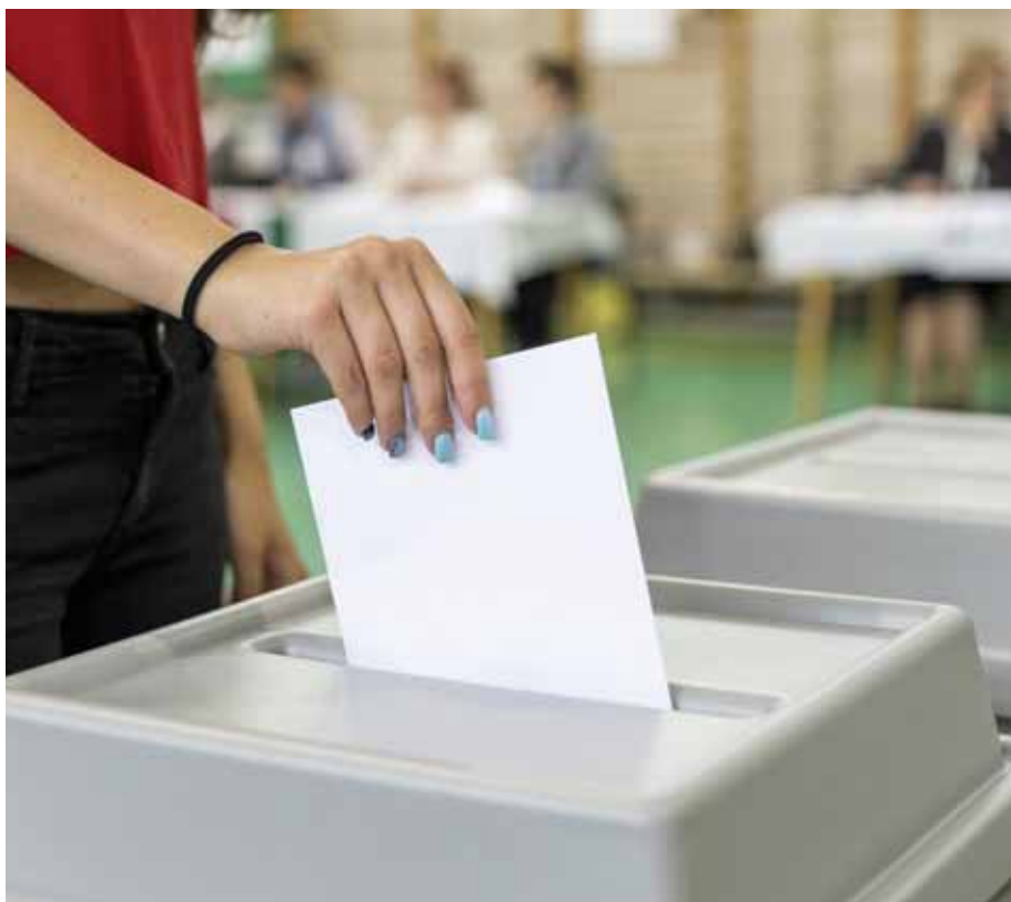
Több szavazólapot kell majd az urnába helyezni

Az idei önkormányzati választás során a szadai választópolgárok három szavazólapot kapnak majd: az egyiken a helyi képviselőket, a másikon a polgármestert, a harmadikon a Pest vármegyei közgyűlésbe juttatandó pártokat kell megjelölni.