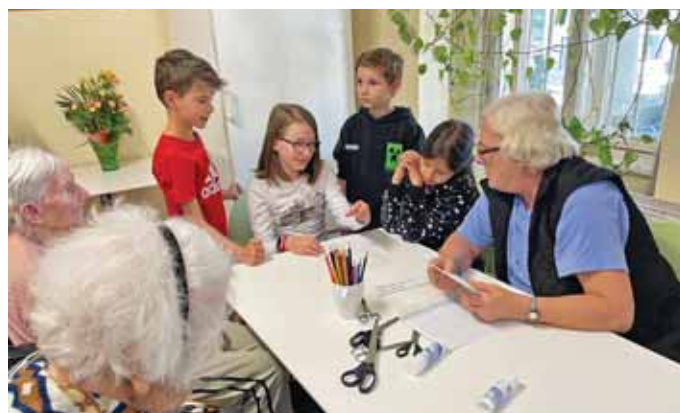
Erősödik a generációk közötti kapcsolat

A tanév során másodszer látogattunk el a Margita Idősek Otthonába a Kicsik és Nagyik című programsorozat keretében. Ezúttal a Föld napja alkalmából először egy kvízfeladatsort oldottak meg öt vegyes csoportban az otthon lakói és a 3. b osztály