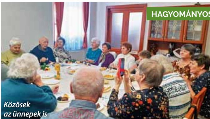
Közösek az ünnepek is