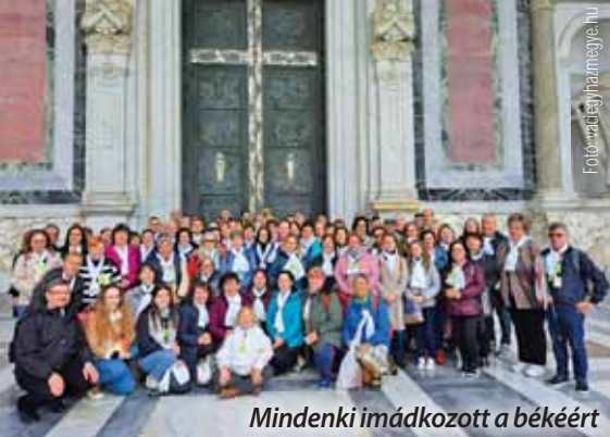
Mindenki imádkozott a békéért