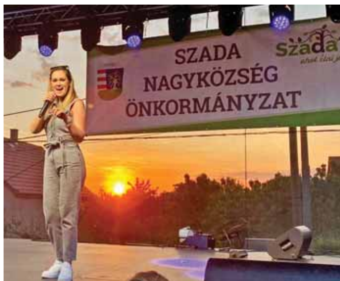
Zenés előadásokból sem volt hiány

valamint életmódtanácsadás is. A nagy melegben is lelkesen mutatkoztak be a Salsation with Sis', a Roc-kin' Board TáncSport Egyesület és a 4M Dance Company hiphoptáncosai is.