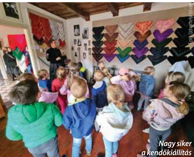
Nagy siker a kendőkiállítás

Közel 800 látogató egy hónap alatt – soha ennyien még nem érdeklődtek a Szadai Tájházban lezajlott programok iránt.