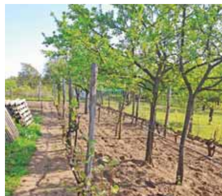
Mindent maguknak termelnek

Az egyre népszerűbbé váló Nem ásvány, mulcsozunk! (No till!) módszer és a szántás, ásás között ellentét látszik, ha szélsőségesen alkalmazzuk. A föld megfelelő időben való megnyitásával a hő, levegő, nedvesség és kozmikus erők számára átjárhatóbbá válik a talaj. Nem mindegy, ezt hogyan csináljuk!