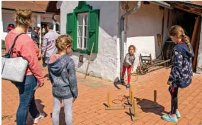
A Tájházak napja idén is nagy siker volt

A Kulturális Alapítvány Szadaért 2023-as tevékenységéről szóló beszámolója: történekekben, eseményekben gazdag volt a tavalyi esztendő.