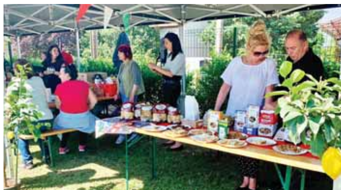
A gasztro utca népszerű helyszín volt ismét

A sport is szokásos eleme a programnak: reggel indult a Focikupa, amivel párhuzamosan több más mozgásformával ismerkedhettek meg a kilátogatók, többek között volt karatebemutató és -edzés,