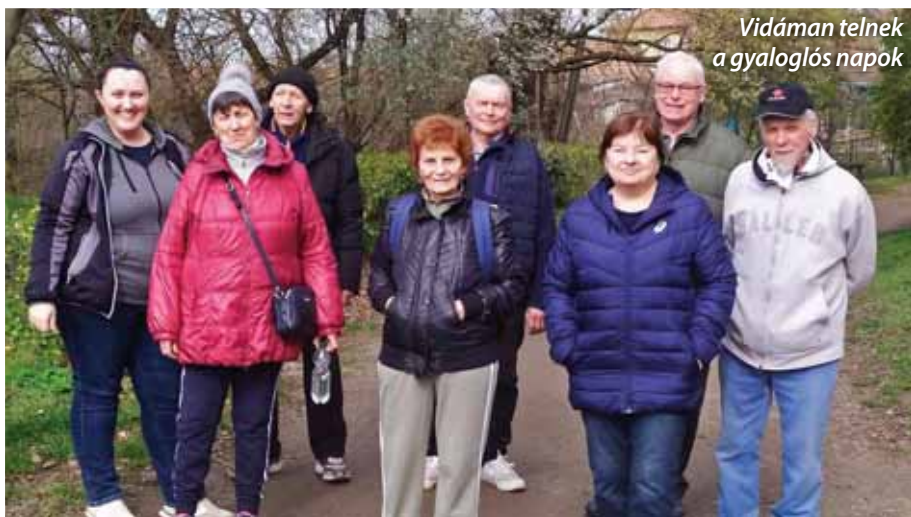
Vidáman telnek a gyaloglós napok