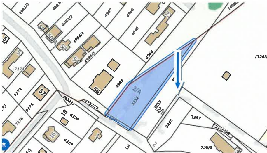
a Szada, 3255 hrsz.-ú ingatlanról