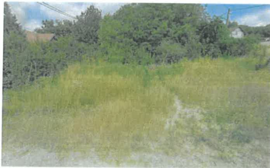
a Szada, Korizmics u. 24. szám alatti 2979 hrsz.-ú ingatlanról