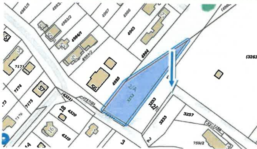
a Szada, 3255 hrsz.-ú ingatlanról