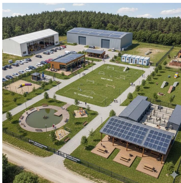
a beruházási szándékot szemléltető, kérelemhez csatolt látványterv

A hivatkozott telkek jelenleg Má-4 övezeti jelű, általános mezőgazdasági terület övezeti besorolásúak, a tulajdonos fejlesztési szándékai ezen övezeti besorolásnak nem felelnek meg. A kérelem célja, olyan új övezet megvalósítása, amely a kérelemben foglalt fejlesztési céloknak megfelelő. Álláspontunk szerint különleges beépítésre nem szánt övezeti besorolás keretein belül a kívánt tevékenység megvalósítható. Az átsorolásnak jogszabályi akadálya véleményünk szerint nincs, ugyanakkor a részletek kidolgozása a telepítési tanulmányterv feladata. Továbbá a helyi építési szabályzat módosításának feltétele továbbá településrendezési szerződés megkötése. A kérelem az előterjesztés melléklete.