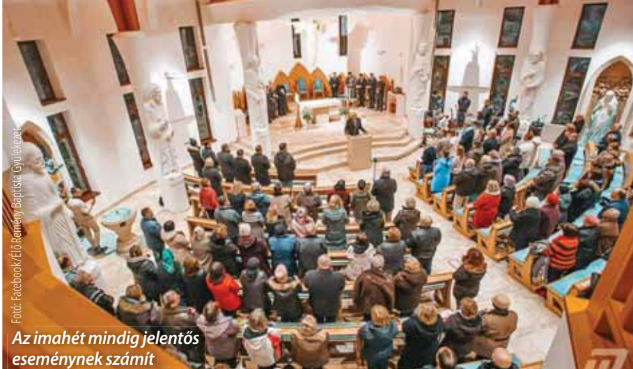
Az imahét mindig jelentős eseménynek számít