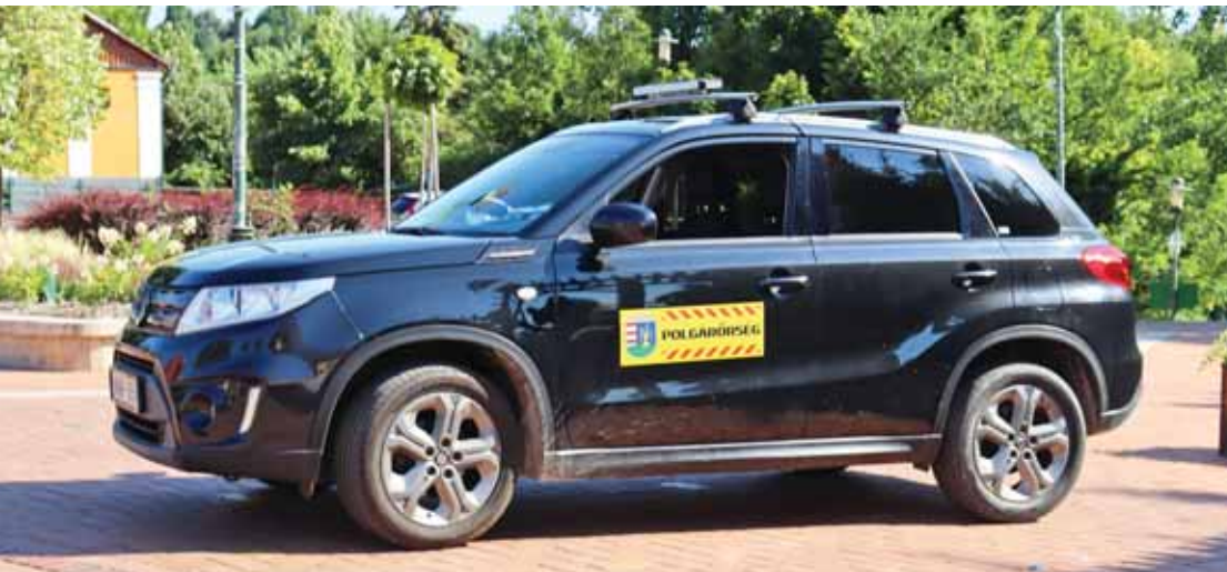
A szadai polgárőrök tevékenységét is segíti a civil pályázat

Idén is lehet pályázni önkormányzati támogatásokra, társadalmi, közbiztonsági és sportcélú programokra. A pályázatok beérkezésének határideje: 2024. február 29.