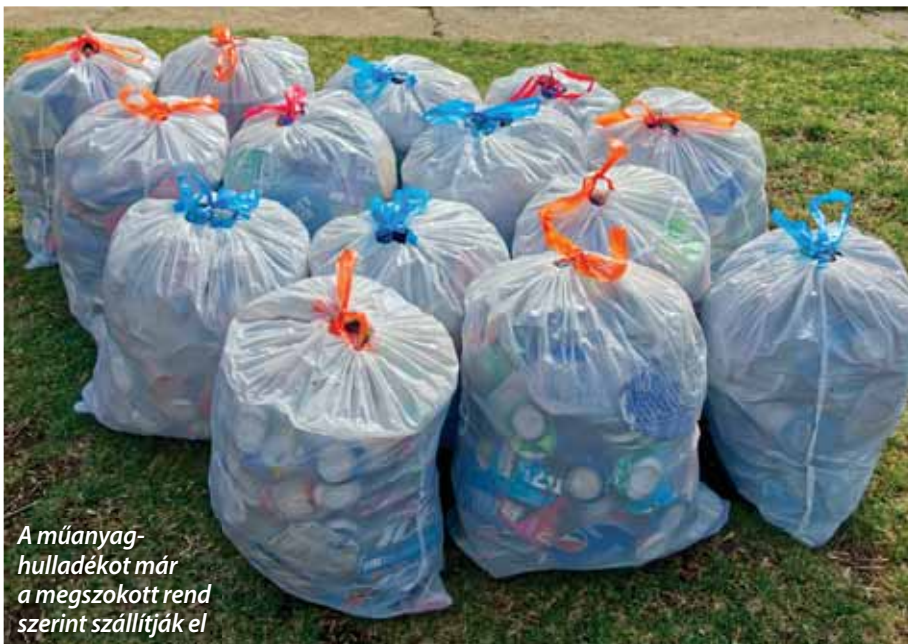
A műanyag-hulladékot már a megszokott rend szerint szállítják el

Mindez azt is jelenti, hogy ha februártól bárki bármilyen problémát észlel a szemétszállításban, közvetlenül a Vertikal ügyfélszolgálatát keresse! Az önkormányzat továbbra is fogadja a panaszokat, de egyebet nem tud tenni, mint hogy továbbítja ezeket a társaság felé, és hangsúlyozottan kéri a szolgáltatás biztosítását. RF