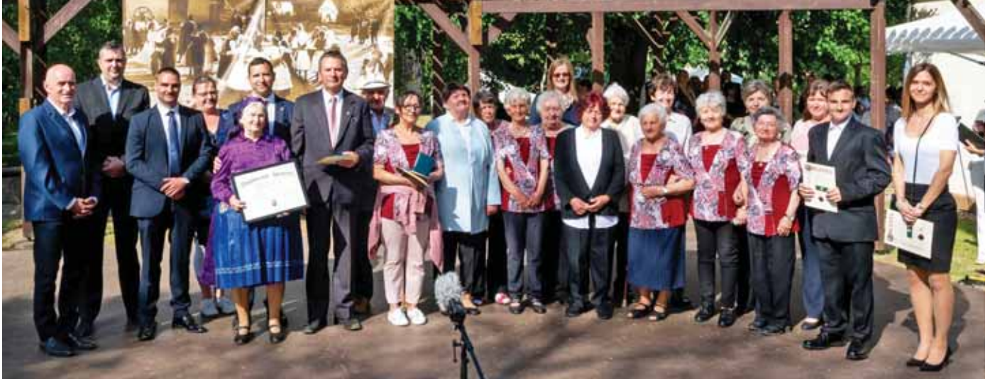
A 2023-as díjazottak közéleti, szakmai tevékenységükkel kiérdemelték az elismerést