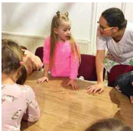
Hosszú az út az iskolába

Nagy dilemma, hogy menjen vagy ne menjen a gyermek iskolába hatévesen. A Székely Bertalan Óvoda-Bölcsőde szakembereihez nyugodtan fordulhatnak a szadai szülők, segítenek a döntésben.