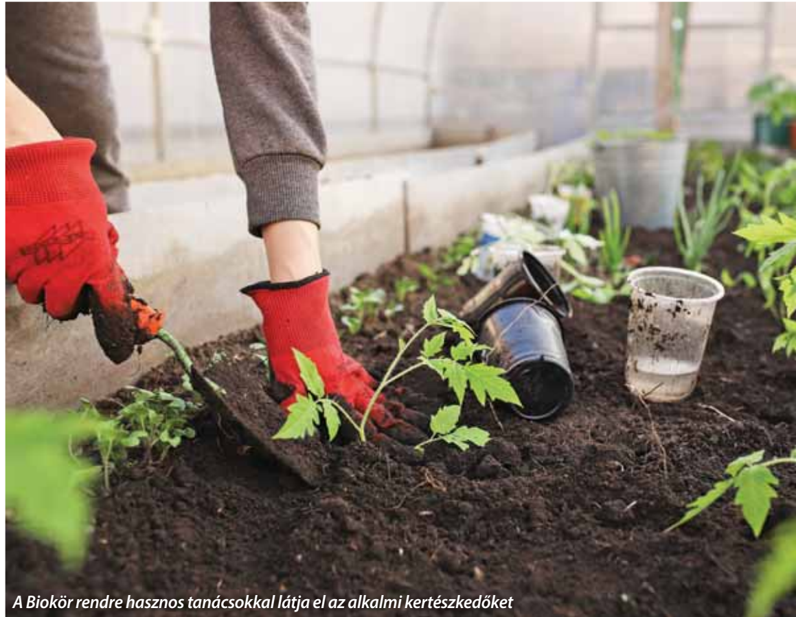
A Biokör rendre hasznos tanácsokkal látja el az alkalmi kertészkedőket

„Palántázunk, mert: 1. a szabadföldi helyre vetésből száz magból olykor csak 5–55 növény lesz! Előre tehát nem tud-