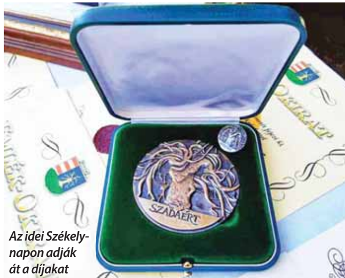
Az idei Székely-napon adják át a díjakat