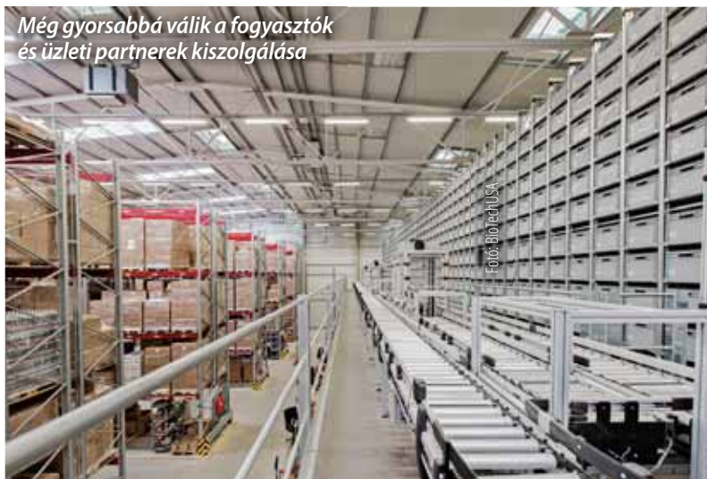
Még gyorsabbá válik a fogyasztók és üzleti partnerek kiszolgálása