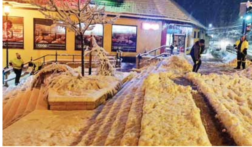
Az ideai téli rendkívüli hóesés komoly kihívást jelentett

A szadai közutak kezelőjének minden évben november 10-ig téli üzemeltetési tervet kell készítenie megfelelő előkészítés, szervezés és megállapodások alapján, mely tartalmazza a közutakkal kapcsolatos téli feladatok megoldási módját, rendszerét és felelőseit. Az időszak március 15-ig tart, így még érdemes összegezni a legfontosabb tudnivalókat.