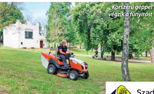
Korszerű géppel végzik a fűnyírást

A Szada Nova Nonprofit Kft. zöldfelület-kezelési koncepció alapján, tervezetten végzi már e tevékenységét. A több részből álló feladatot folyamatosan ismertetjük lapunkban. Ezek közül a kaszálás a talán legkevésbé kiszámítható a változó időjárás miatt.