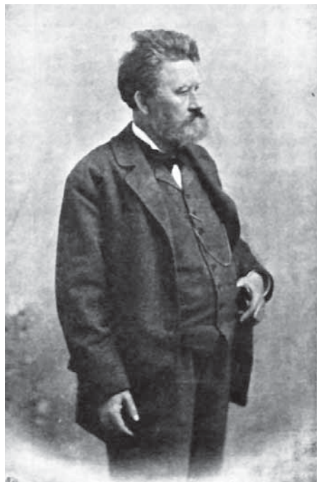
Székely Bertalan portréja (Erdélyi Mór, 1900)

Székely Bertalan művészetét rengeteg nézőpontból lehet elemezni. Szinte minden kornak vagy korban mást és mást jelentett. Születésének 188. évfordulója alkalmából ezúttal kortársainak 20. század elején közreadott visszaemlékezéseiből válogattunk.