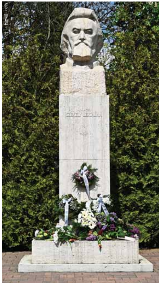
A szadai síremlék friss koszorúkkal

Lajos király képét 1860-ban festette Székely. Dobozit 1861-ben, a Mohácsi veszt