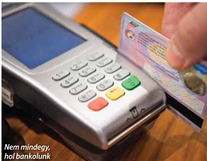
Nem mindegy, hol bankolunk

Az ügyfeleket a bankszámlaköltségek csökkentésében segíti az évente kézhez kapott díjkimutatás, amelyet idén január végéig megkapott minden ügyfél, és amely tartalmazza a bankszámlához kapcsolódó minden lényeges költséget részletes bontásban. A kötelezően kiküldött díjkimutatást a net-