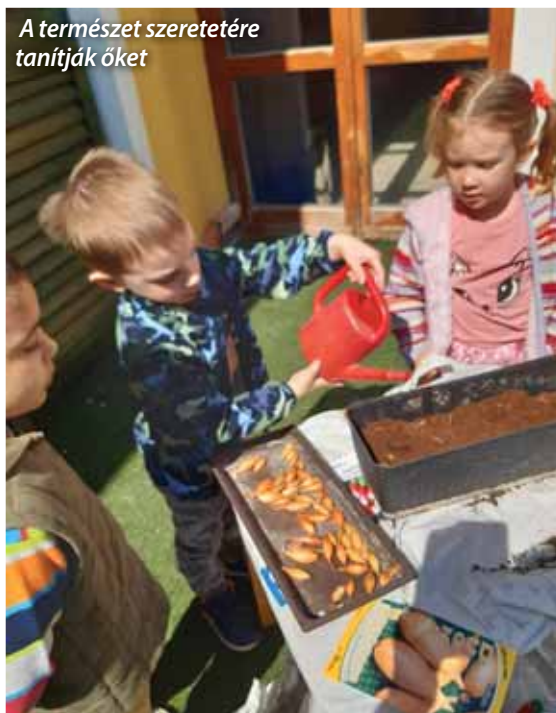
A természet szeretetére tanítják őket

Óvodánk Süni csoportjában egy leendő óvodapedagógus nyolchetes szakmai gyakorlatát töltötte, akit nagy örömmel fogadtak a gyerekek és az óvónők is. Igyekeztünk minél több szakmai tudást, tapasztalatot megismertetni és átadni számára a hetek folyamán. Büszkeséggel tölt el minket, hogy olyan nevelőtestületünk van, ahol van mit és van kitől tanulni a mai pedagógushíánytól terhes időben! A kollégajelölt min-