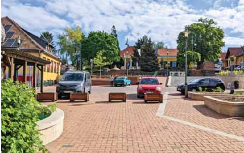
Fő térként kell keresni ezentúl

Döntés született belterületbevonási kérelem elutasításáról, termőföld más célú hasznosítására irányuló eljárás kezdeményezéséről, továbbá arról, hogy a képviselő-testület az önkormányzat Szada, 593/17. hrsz.-ú „kivett közterület” besorolású ingatlanát „beépítetlen terület” besorolásúvá kívánja átminősíteni, amely szükség és igény esetén a későbbiekben akár tartós használatba is adható. AP