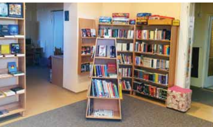
Kellemes környezet az olvasóknak

Benéztünk a szadai Bagolyvár könyvtárba, ott hogyan ünnepeltek, hogyan zajlottak a mindennapok. És egy rövid helyzetértékelésre is vállalkoztunk.