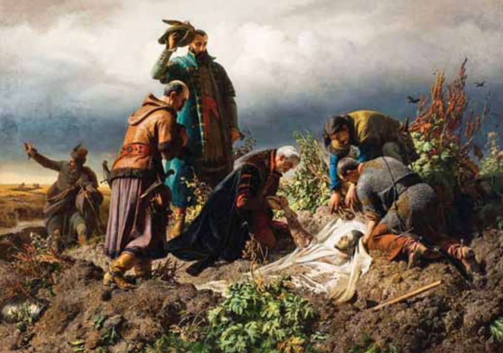
A II. Lajos holttestének megtalálása című festmény az MNG-ben található

A Székely Bertalan-nap keretében nyílt meg a Műteremházban a Székely Bertalan templomi festészete – válogatás a vallási témájú vázlatokból című kiállítás. A tárlat június 11-ig tekinthető meg előzetes bejelentkezés alapján.