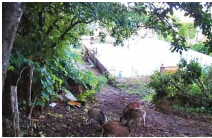
A vadkamerákon keresztül követhetők a „betolakodók”

A szakembernek vezetett statisztikája van mindegyik településről, de ezek nehezen választhatók el az adottságok miatt. Az egy egységnek tekinthető Veresegyházon, Szadán és Gödöllőn a februárral zárult vadászi évszakban 40 vaddisznót lőtt