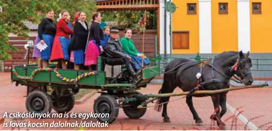
A csikóslányok ma is és egykoron is lovas kocsin dalolnak/daloltak