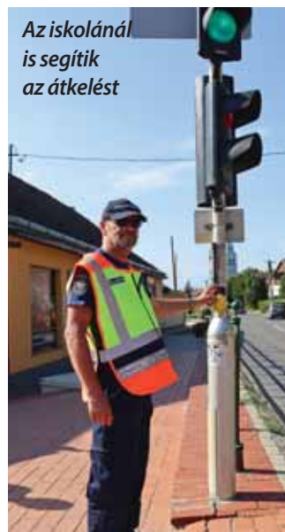
Az iskolánál is segítik az átkelést