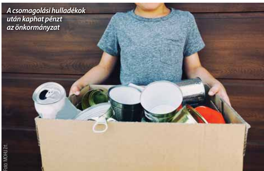
A csomagolási hulladékok után kaphat pénzt az önkormányzat

A hazai hulladékgazdálkodási rendszer átalakítása az önkormányzatokat is érinti. Ilyen irányú alapfeladatuk megszűnik, csak a köztisztasági feladatellátás marad náluk.