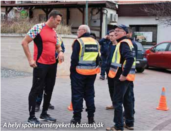
A helyi sporteseményeket is biztosítják