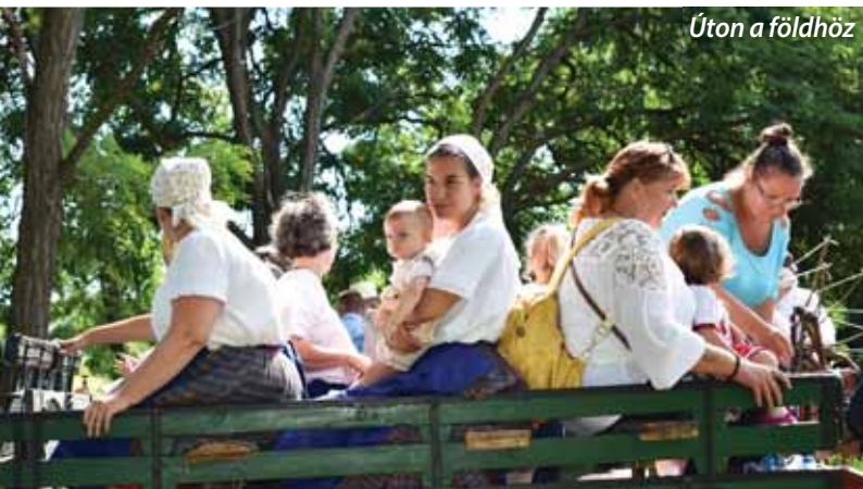
Úton a földhöz