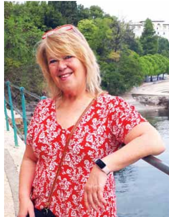
Benke Éva szívesen szervez

milyen más művészeti ágba is megmutatják tehetségüket. Idén Esztergályos Cecília színművésznő festményeit és kerámiáit láthatják majd az Art udvarban. Az est szó