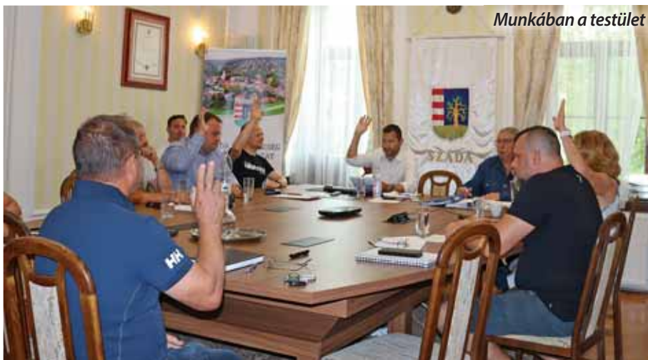
Munkában a testület