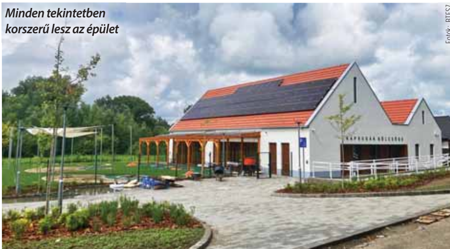
Minden tekintetben korszerű lesz az épület