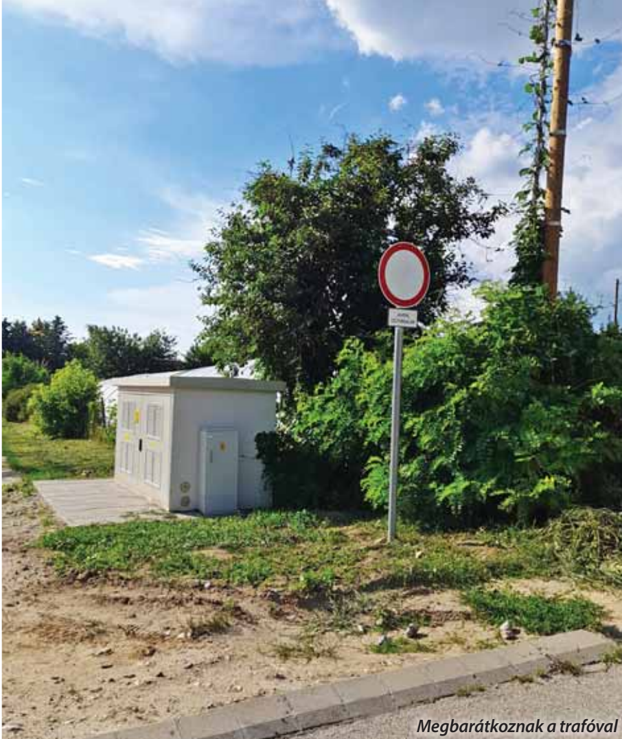
Megbarátkoznak a trafóval