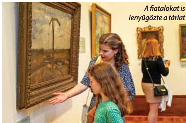
A fiatalokat is lenyűgözte a tárlat