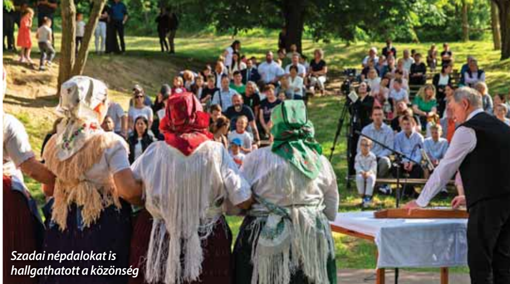
Szadai népdalokat is hallgathattak a közönség