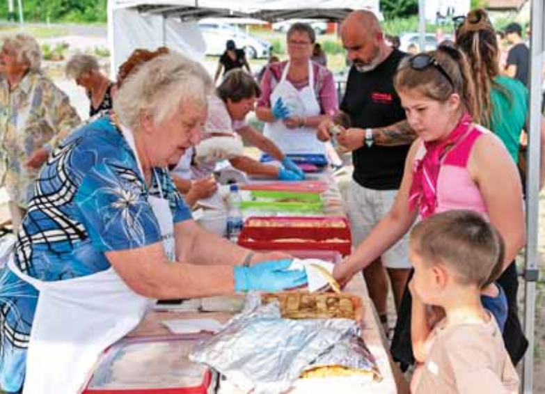
A Szuper Nagyik palacsintája kelendő volt