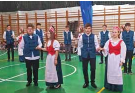
Nagy siker volt a palotás tánc

A hagyományoknak megfelelően az idei tanévben is tartottunk megemlékezéseket iskolánk névadójáról, Székely Bertalan festőművésztől.