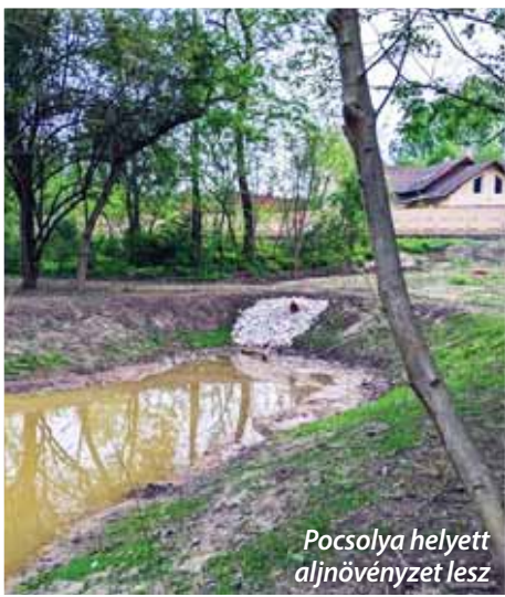
Pocsolya helyett aljnövényzet lesz

A Székely Bertalan úti esőkert a folyamatosan figyelemmel kísért apadási tendenciájának megfelelően néhány héten belül kiszárad, és a meder náddal, sással beültethető lesz, a növényzettel benőtt felület vízfeltevő képessége így megnő. A pocsolyák – a Tavirózsa Egyesület szakemberei által jóváhagyott – szúnyoglárvairtó szerrel való kezelése megtörtént, és szükség esetén a településüzemeltetés munkatársai erről folyamatosan gondoskodnak. Az esőkert medrét várhatóan 1–2 éven belül benővi a mocsári növényzet, így a későbbiekben a vízmegtartás már csak a talajban történő raktározást fogja jelenteni. A fentiek következtében az elkövetkező időszakban a szúnyogok forrásai az 1 km-es körzeten belül található vizes élőhelyek, kisebb vízállások, de akár a kertekben otthagyt vizeskannák lehetnek.