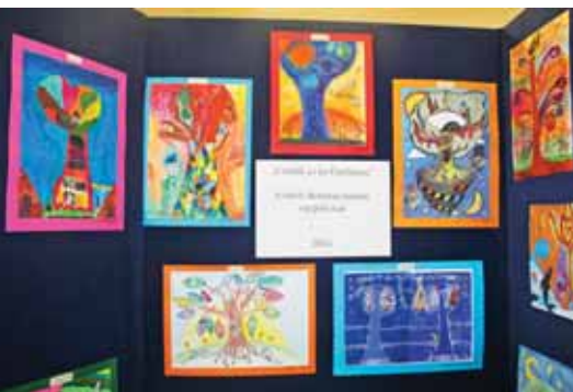
Kiváló rajzok készültek

A névadónk életrajzi adatait, festményeit, valamint Szadához való kötődését minden évben tanulmányozzuk, ismereteinket évről évre gyarapítjuk. Erről a tudásról adhattak számot diákjaink a Székely-akadályversenyen, ahol az alsó és felső tagozatosok külön útvonalakon, hat-hat állomáson teljesítették a feladatokat. Tari