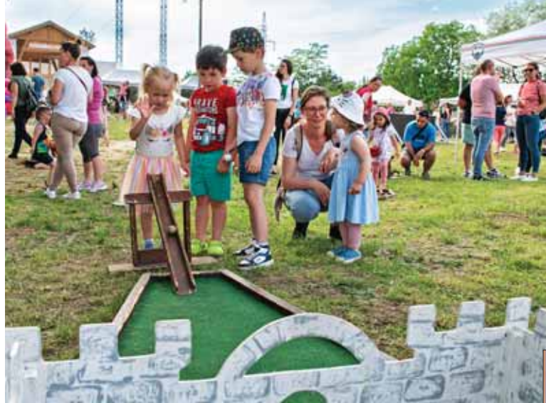
Ügyességi játékokat is ki lehetett próbálni