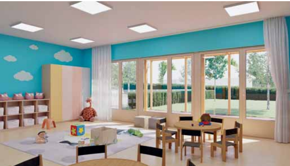
Tágas belső várja az új bölcsiseket

Újabb 28 bölcsődei férőhely válik elérhetővé a szadai családok számára 2024. szeptember 2-től. A Baptista Tevékeny Szeretet Misszió hazai és uniós támogatásból Szada mellett másik három településen egyszerre épít bölcsődéket.