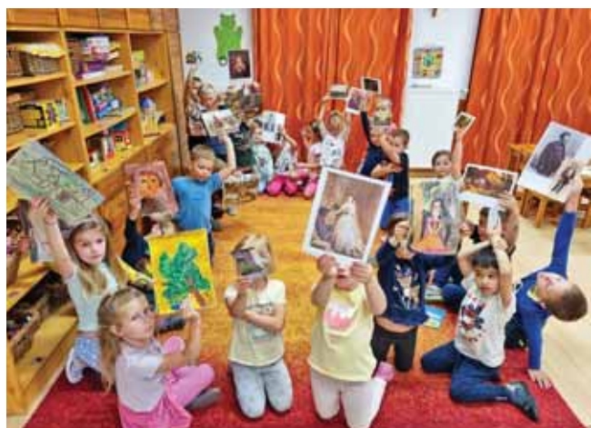
Jó évet zártak ismét az ovisok

Az ovisokat és családjaikat vendégül látta cseresznyeskertjében a Csemete Tánoda, a Galambos , Hegedűs és Bakos család járt ott. Minden gyermek maga szedhette a gyümölcsöt a fáról, és megehetett annyit, amennyi csak belé fért. Tetőtől talpig piroslottak a cseresznye levétől, és fülbevalót is raktak maguknak, ami kitartott az oviig. Köszönjük a nagylelkű felajánlást minden családnak! A Csemete Tánoda ezenfelül minden csoportot meghívott térítésmentesen kertészkedni, ültetgetni. A munka után szórakozás várt a gyerekek-