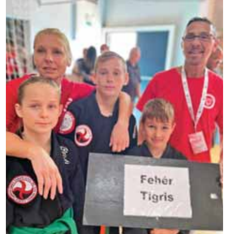
Kempokák és mestereik