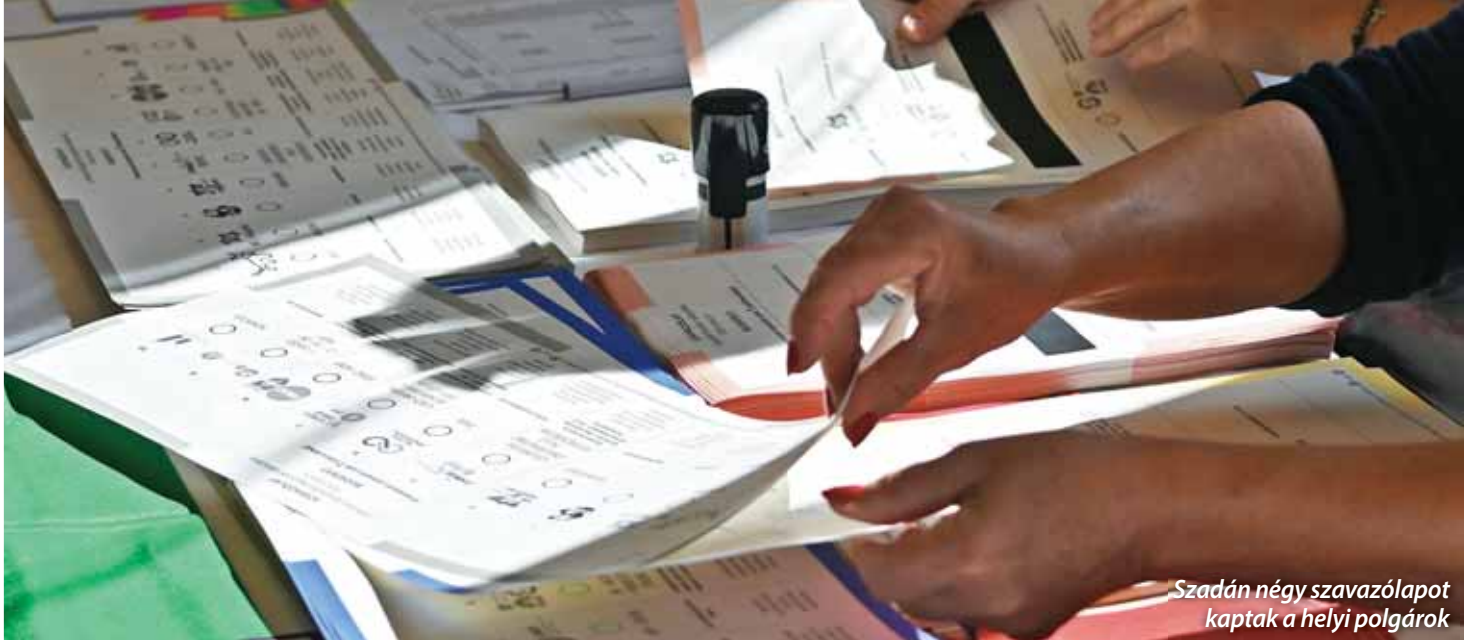
Szadán négy szavazólapot kaptak a helyi polgárok

lődési feladatfinanszírozás mértéke nem fedezi sem a fenntartás, sem a fejlesztés költségeit, a feladatfinanszírozás mértékének emelése szükséges” – jegyezte meg a TÖOSZ az állami finanszírozásról.