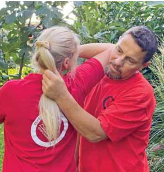
Nem kell megijedni

A hölgyek sokkal inkább ki vannak téve erőszaknak, és ezt felismerve indul önvédelmi képzés számukra. A legfontosabb védekezési technikák elsajátítására nyílik lehetőség szeptemberben.