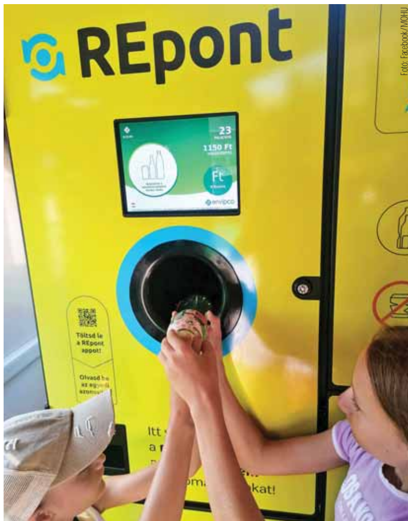
A kevés palackkal még elbírnak az automaták