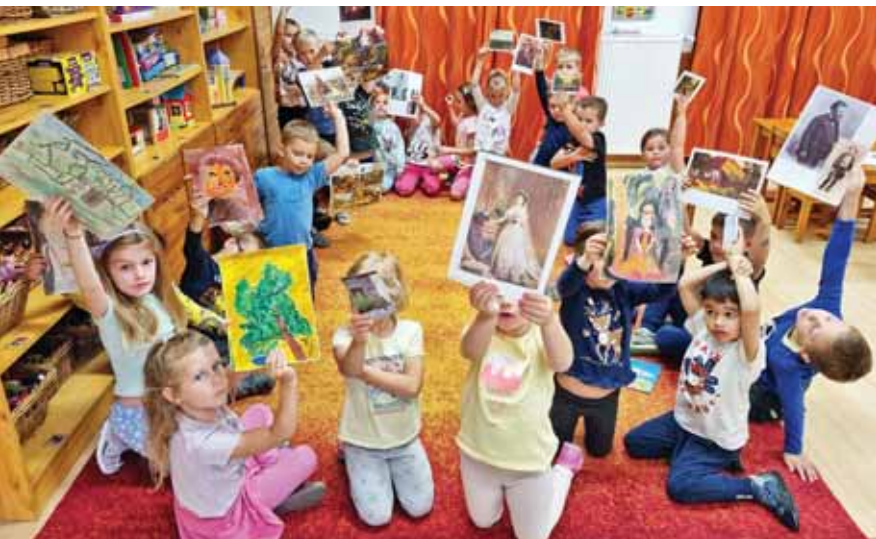
A gyerekek érdekében történik minden fejlesztés, jobbtús

Véget ért a 2023/24-es nevelési év a Székely Bertalan Óvoda-Bölcsődében. Az intézmény vezetője részletesen is összefoglalta mindazt, ami szakmai szempontból kiemelkedő volt.