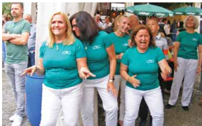
Vidám hangulat övezte a neukirchi napokat

Neukirchből sokan járnak dolgozni a közeli városokba, de a lakosság egyötöde ma is mezőgazdasággal foglalkozik. Csoportunk tagjai – köztük nem egy gazda, agrár- vagy gépészmérnök – „Gyümölcstermő Szent Szadáról” érkezve ebből is izelítőt kaphattak a vendégfogadó családoknál vagy például a faluhoz tartozó Hinteressachban. Itt a Hexenfest – vagyis a messze földön