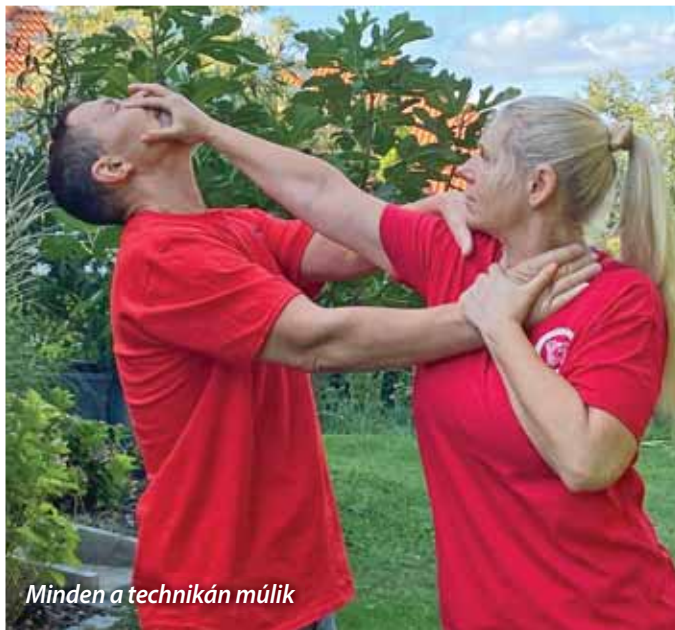
Minden a technikán múlik

Nőként a gyengébb fizikai felépítés bizonyos hátrányt jelent, de egy megfelelően