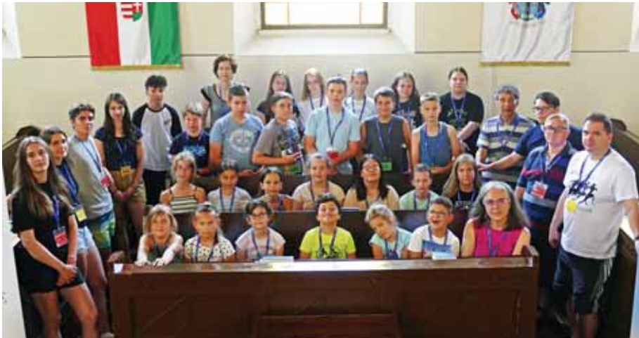
Öröm és békesség hatotta át a táborokat

A nyár a kikapcsolódás, a pihenés és a nyaralás időszaka. Végre kiszakadhatunk a megszokott hétköznapi napokból és pihenhetünk, vagy éppen kipróbálhatunk új dolgokat. Ugyanakkor a nyár a gyermekek számára a táborozás időszaka is. Sokféle tábor várta őket az idén is, ami segített a dolgozó szülőknek, hogy jó helyen tudhatták csemetéiket, ugyanakkor a gyermekeknek is sok új élményt, izgalmas kalandokat hozott.