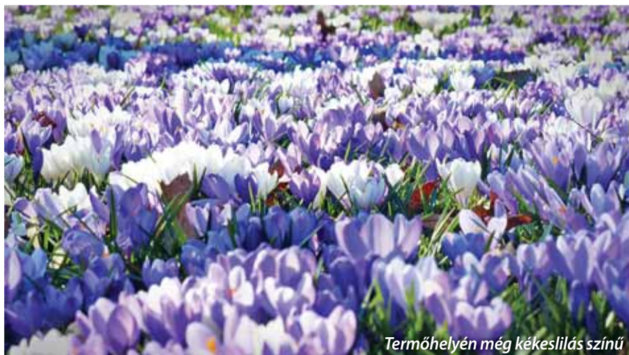
Termőhelyén még kékeslilas színű

Már nem annyira a hagyomány őrzése, hanem a biztonságos élelmiszer-előállítás és a természetes környezet megtartása miatt fontos értékelni, számba venni és ösztönözni Szada élelmiszer-termelő kertészeti kultúráját. Sorozatunkban ezúttal egy különleges, sáfránytermesztő kisgazdaságot mutatunk be.