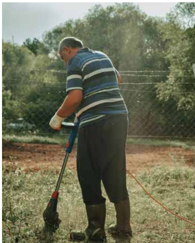
A fűvet is csak adott időhatárban szabad nyírni

a) munkanapokon 20 és 24 óra, valamint 0 és 7 óra között, b) szombaton 0 és 8 óra, valamint 18 és 24 óra között,