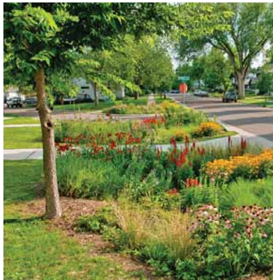
Az esőkert javítja a mikroklimát

A mélyre kotort és kiegyesített medrek gyorsan elvezetik a vizet, ezért szárítják a tájat. A projektben a vízvisszatartás növelését, ártér-rehabilitációt, valamint a pa-