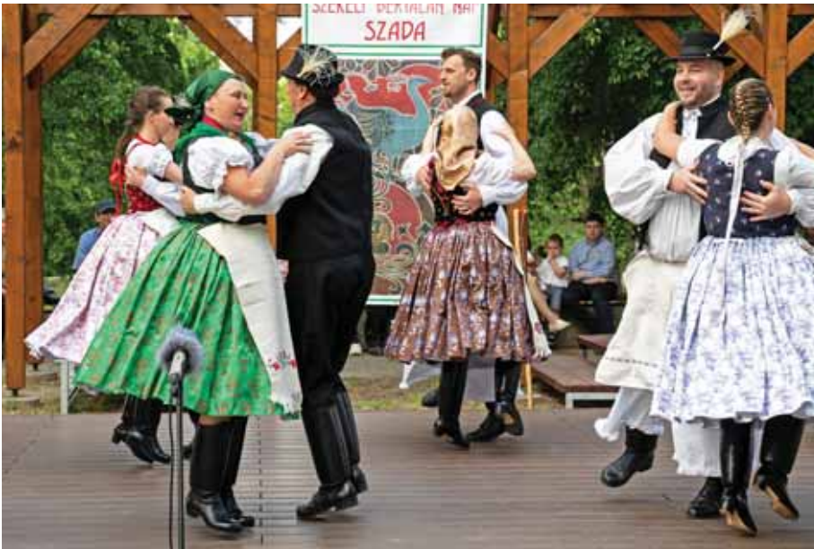
A szadai néptáncosok színvonalas műsort mutattak be