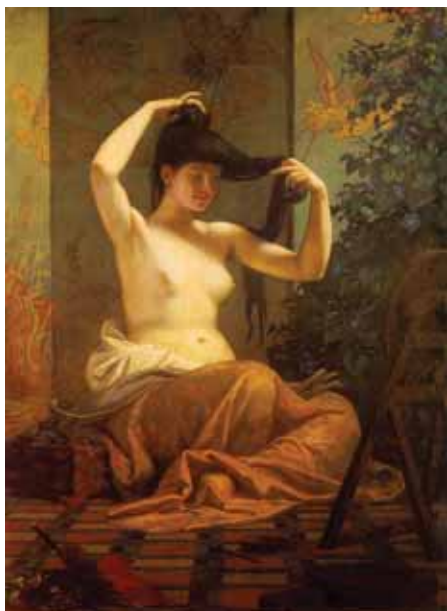
Kiállított Székely-képek: Japán nő...

Az évente hagyományosan megrendezett Székely-kiállításunk június 15-ig várja a látogatókat. Tárlatunk a mester nőket ábrázoló alkotásainak különböző csoportjait mutatja be néhány jellemző műve és a hozzájuk kapcsolódó vázlatok segítségével.