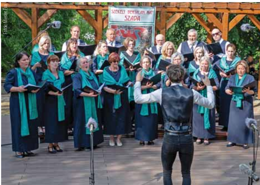
A Szadai Szólamok kórus a díjátadó üde színfoltja volt