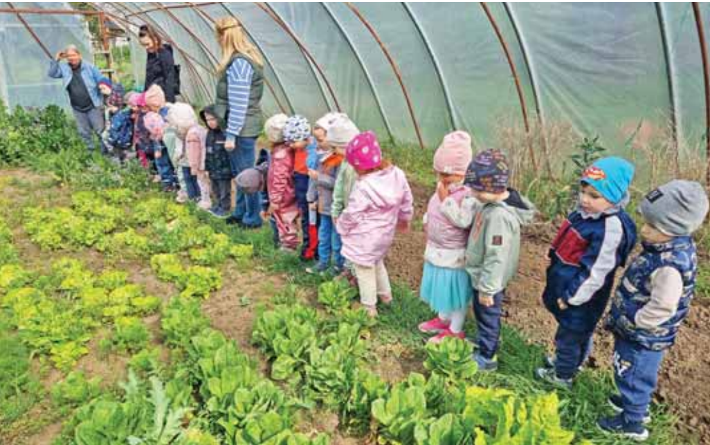
Kiemelt téma volt a kicsiknél a Föld napja

Áprilisi hónapunk is bővelkedett különböző szórakoztató, ismeretterjesztő és sportprogramokban.