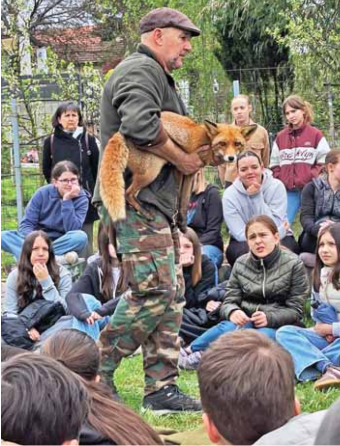
Nagy meglepetést okozott az élő róka