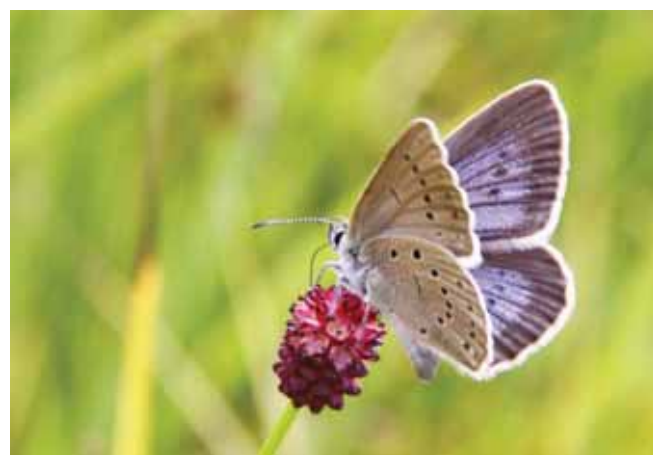
A vérfű-hangyaboglárka az egyik megőrzendő faj

A fejlesztés során a medret borító tófóliát elbontjuk, a kotrást követően pedig természetes vízzáró agyagréteg terítést kap