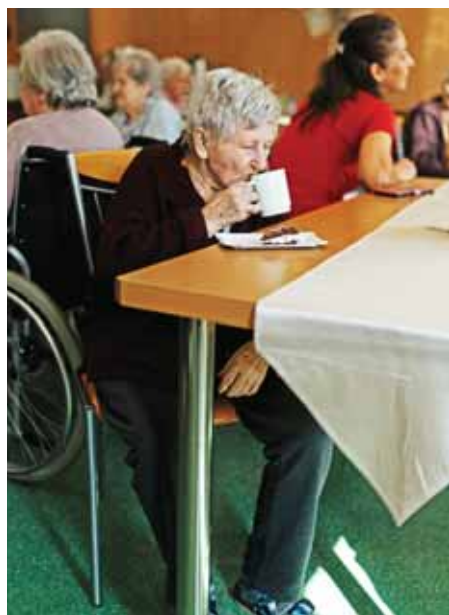
Figyelnek az idősekre

Ezt követően a képviselő-testület áttekintette a lejárt határidejű határozatokat, valamint a polgármesternek két ülés közötti időszakról szóló beszámolóját, majd rátért a napirendi pontok tárgyalására.