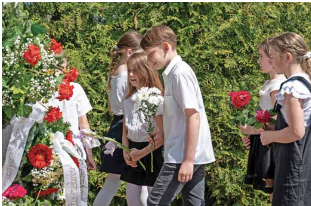
Az önkormányzat és az intézmények vezetői mellett a diákok is koszorúztak

Ezt követően került sor a Székely-kertben a települési díjak átadására azok számára, akik Székely Bertalan kultuszának ápolásáért sokat tettek, illetve akik a gazdasági, társadalmi, tudományos vagy művészeti életben maradandót alkottak, egész életművükkel vagy kiemelkedő munkásságukkal szolgálták a kultúra, a művészet, a sport ügyét, hozzájárulva a nagyközség jó hírnevének öregbítéséhez. Szada ön-