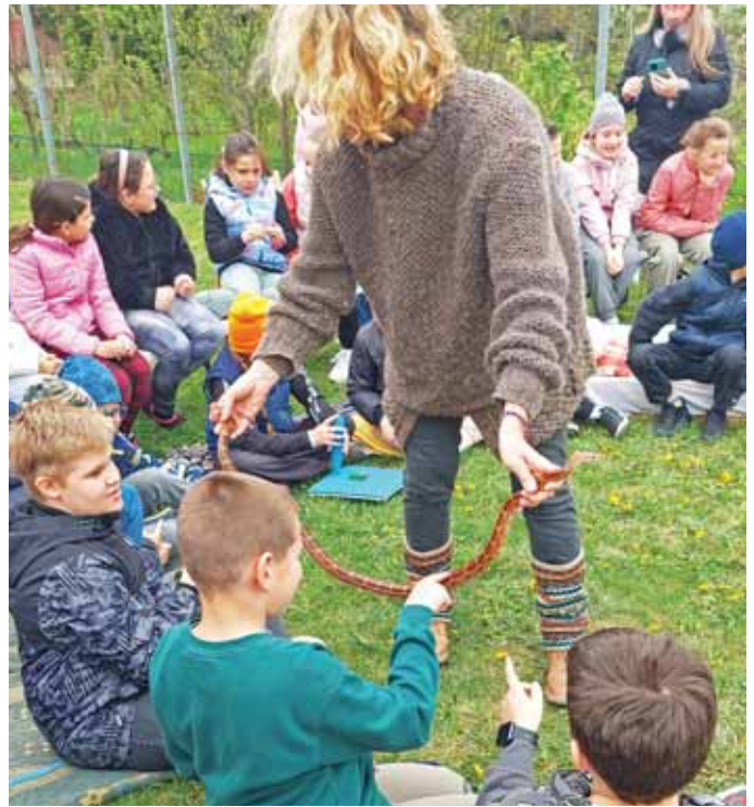
És egyszer csak előkerült a gabonasikló is