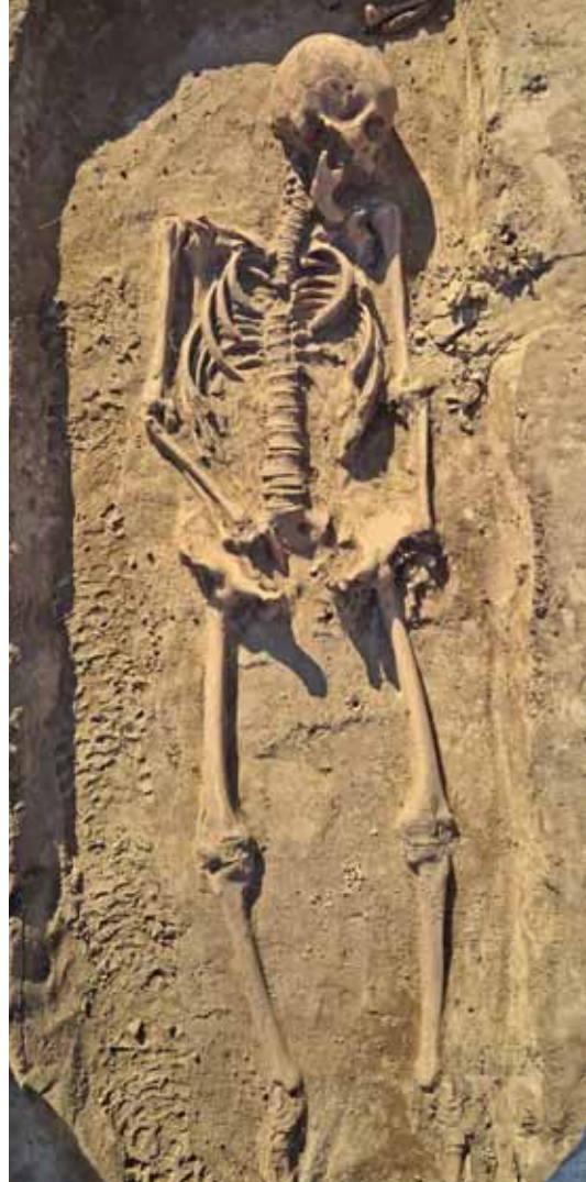
A holttesteket egymásra helyezve temetkeztek