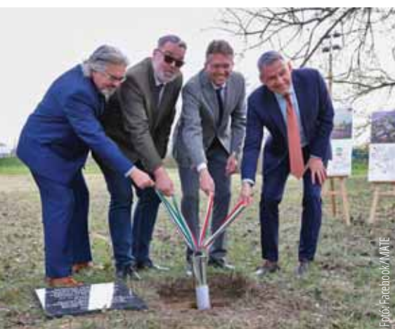
Alapkő letéve, de az építkezésre még várni kell

Elhelyezték az új Magyar Mezőgazdasági Múzeum és Könyvtár (MMMK) alapkövét a Magyar Agrár- és Élettudományi Egyetem (MATE) gödöllői Szent István Campusán.