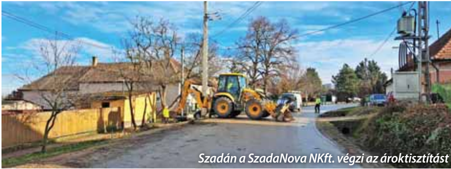
Szadán a SzadaNova NKft. végzi az ároktisztítást

Új sorozatunkban egy-egy közérdeklődésre számot tartó, a közösségi együttéléssel, a közterületekkel, a lakóingatlanokkal kapcsolatos témát ismertetünk. Elsőként: miért fontos az ingatlanok előtt lévő csapadékvíz-elvezető árok tisztítása?