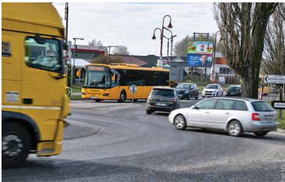
Sűrű az átmenő forgalom a települések között

– Szada és Veresegyház esetében is a 2022-ben jóváhagyott rendezési tervekkel összhangban van az elképzelt nyomvonalak mindegyike. Lakóövezeteket nem érint egyik esetben sem! Fontos rögzíteni, hogy minden egyeztetésen elhangzott a miniszteriumok részéről, hogy az előkészületek is az ún. feltételes közbeszerzések körébe tartoznak. Így a Veresegyház és Szada közötti elkerülő út nyomvonaltervét kész bejelentésként helytelen értelmezni! Az ÉKM beruházási osztálya még márciusban kapott felkérést arra, hogy feltételes közbeszerzést írjon ki a tervező kiválasztására. A kiválasztott tervezőcéggel akkor tud szerződést kötni az ÉKM, ha arra költségvetési forrást biztosítanak számára. Ezt követően indulhat el tervezési folyamat, ami koncepció- és tanulmánytervekből, környezetvédelmi előzetes vizsgálati dokumentációból áll. A társadalmi elemzések és a nyomvonalváltozatok gazdasági elemzését követően kerülhet arra sor, hogy az engedélyezési és kiviteli terveket elkészítheti a tervező. Az ÉKM beruházási osztályával folytatott személyes egyeztetés alapján ennek a folyamatnak az időtartama legalább három év! Fontos tehát rögzíteni, hogy nincs kész terv, nincs elfogadott és jóváhagyott nyomvonal az elkerülő útra! Az egyeztetéseken minden esetben ezen folyamatok megindításáról született döntés – a végső kimenetel a kormányzati átadás-átvétel hosszától, a terület új minisztériumától is függ.