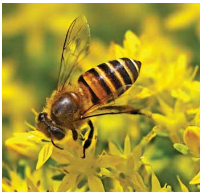
A házi méh jóbarát

A kerttulajdonosok sokat tehetnek a beporzók támogatásáért. Az egyik legegyszerűbb módszer a vegyszermentes kertészkedés. Fontos a változatos, egész szezonon át virágzó növények telepítése. A vízforrás biztosítása is segíti a rovarokat, egy kavicsokkal töltött sekély tál ideális itató lehet.