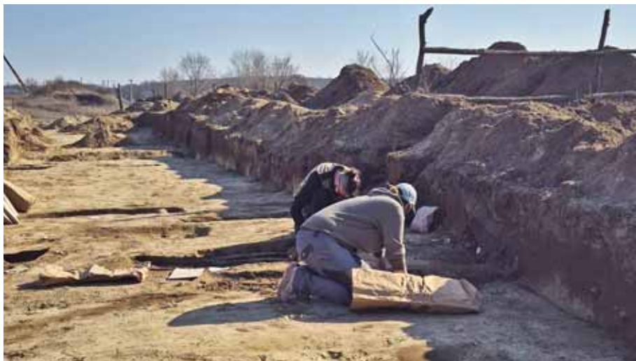
Minden részletre figyeltek a régészek

hetett ásni a határon túl, de fordított esetben a földben kellett hagyni a maradványokat.