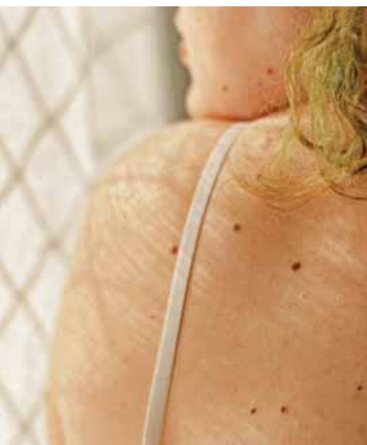
A melanómaszűréssel az anyajegyeket vizsgálják

Ebben az esztendőben is folytatódnak a lakossági népegészségügyi szűrővizsgálatok. Egy korai betegségfelismerés akár életet is menthet.