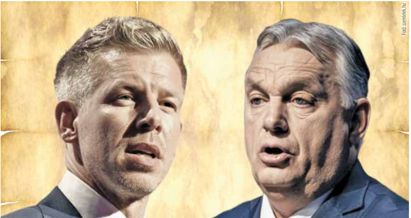
Magyar Péter (balra) a semmiből két év alatt hozott létre új kormányzó erőt, amivel leváltotta Orbán Viktor (jobbra) kormányát