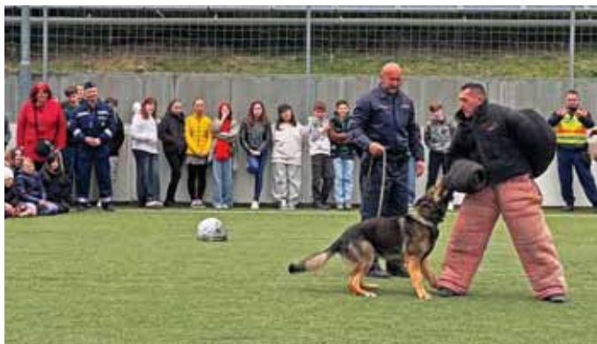
Lenyűgöző bemutató volt

F ekete Krisztián vezetésével a Pest Vármegyei Rendőrkapitányság Mélyégi ellenőrzési osztályának kutyás rendőrei érkeztek hozzánk. A rendkívül látványos, mintegy félórás program során különböző életszerű helyzetet mutattak be, amelyekben a rendőrkutyák gyors és fegyvelmezett reakcióit figyelhet-