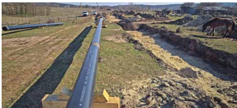
A csővezeték „készenlétben”

a helyszínen kutatást, mielőtt a Mol Zrt. akkoriban korszerűsítette volna a Barátság I. kőolajvezetéknek, illetve a gázt szállító vezetéknek e területen futó szakaszát. Ő az akkori feltárás miatt követte figyelemmel a most zajló régészeti munkát. Hozzáátette, hogy most mintegy másfél kilométeres szakasz kutatására kaptak engedélyt, ezen belül is kb. 3 méter szélességű és kb. 0,5–1 méter mélységű űrszelvényre. Amit ezen belül találtak, azt lehetett regisztrálni, leltárba venni. Ha például egy emberi csontváz maradványának nagyobb része a szélességi határon belül volt, de a kisebb része kívül, akkor ezt még ki lehetett venni, át-le-