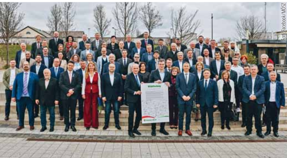
Egységesen álltak ki az önkormányzati rendszer újjáalakulásáért

A Magyar Önkormányzatok Szövetségének (MÖSZ) március 20-i gödöllői konferenciáján a mintegy száz települést, annak több mint hárommillió lakosát képviselő polgármesterek álltak ki az önkormányzatiság megerősítése, a települések jogainak és lehetőségeinek helyreállítása mellett.