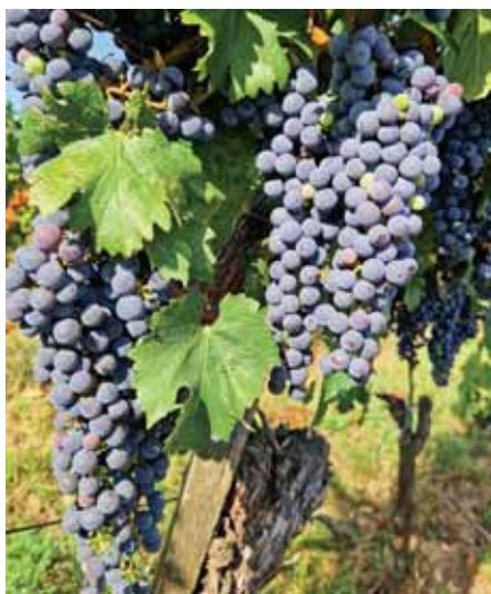
A jó borhoz minőségi szőlő szükséges

Már nem is annyira a hagyomány őrzése, hanem a biztonságos élelmiszer-előállítás és a természetes környezet megtartása miatt fontos értékelni, számba venni és ösztönözni Szada élelmiszer-termelő, kertészeti kultúráját. Sorozatunkban ezúttal a helyi borászegyletet mutatjuk be.