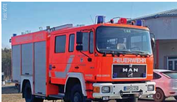
A beszerzett tűzoltókocsi egyelőre bevetésre vár