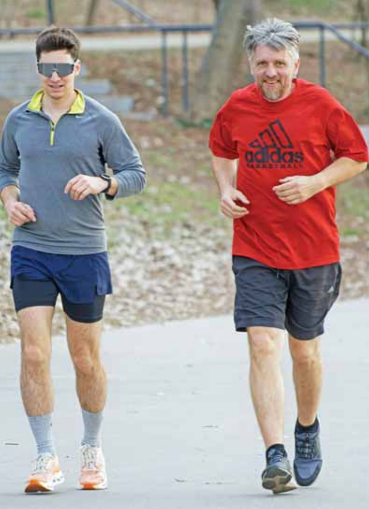
A mozgás is segíthet az egészség fejlesztésében

foglalkoztatásból kiszorulva a tartósan munka nélkül lévők túlélési stratégiákat – például feketegazdaságban való részvétel, segélyezett létre való áttérés, rokkantnyugdíjassá válás, stb. – alakítottak ki. Így szükségszerű, hogy a segítségnyújtás új formái jelenjenek meg a célcsoportok körében. Elsősorban a társadalmi és munkaerőpiaci integráció elősegítésére, a segélyezett passzív ellátása helyett az aktív részvétel