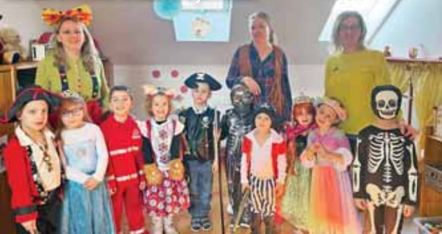
Mindenki korán kitalálta a jelmezt

2111 Szada, Dózsa György út 63. Tel.: (28) 503-586, E-mail: ovoda@szada.hu, Honlap: szadaovi.wix.com/ szadaovi