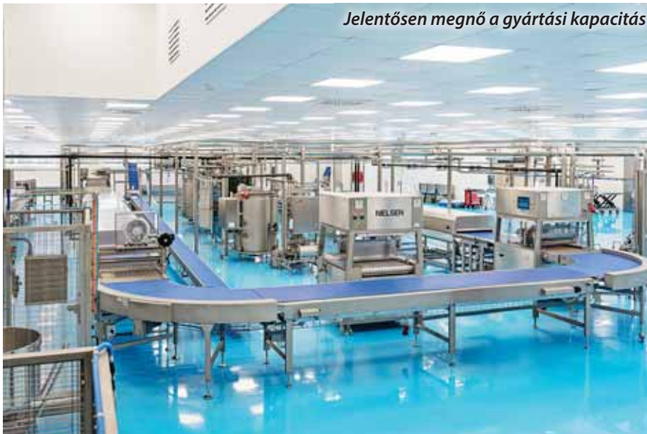
Jelentősen megnő a gyártási kapacitás

Történetének legnagyobb volumenű, mintegy 9 milliárd forint értékű beruházását valósította meg a hazai tulajdonú BioTechUSA. Szadán új gyártósort helyeztek üzembe, ezáltal jelentősen megnő az előállítási kapacitás.