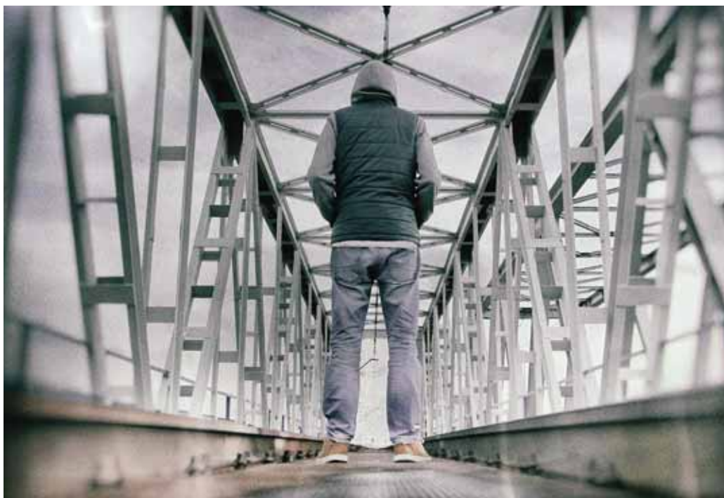
A kilátástalannak vélt élethelyzetből is van kiút

– A hosszú ideje tartó munkanélküliség – esetenként a több generáción átívelő munkanélküliség – a munkavállalói készségek, a társadalmi kapcsolatok és személyes képességek leépülését, az anyagi ellehetetlenülést, a motiváció teljes hiányát hozza magával. A leggyakrabban alkalmazott aktív munkaerőpiaci eszközök, a képzés/átképzés, a közhasznú foglalkoztatás, a bértámogatás vagy nem érintik a helyi leghátrányosabb helyzetű célcsoportokat, vagy csupán rövid ideig biztosítanak számukra jövedelmet. Emiatt és a legális