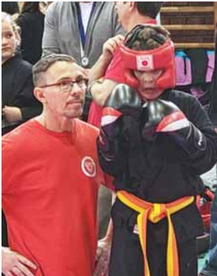
Jól felkészítették a kistigriseket

A szadai Fehér Tigris Szabadidő- és Sportegyesület utánpótláscsapata évről évre részt vesz a rangos szigetalmi kempó-utánpótláskupán, amelyet idén február 15-én rendeztek meg; két nemzet 22 egyesületének 138 versenyzője 9 stílusban mérte össze tudását. A „kistigrisek” hűek maradtak a hagyó-