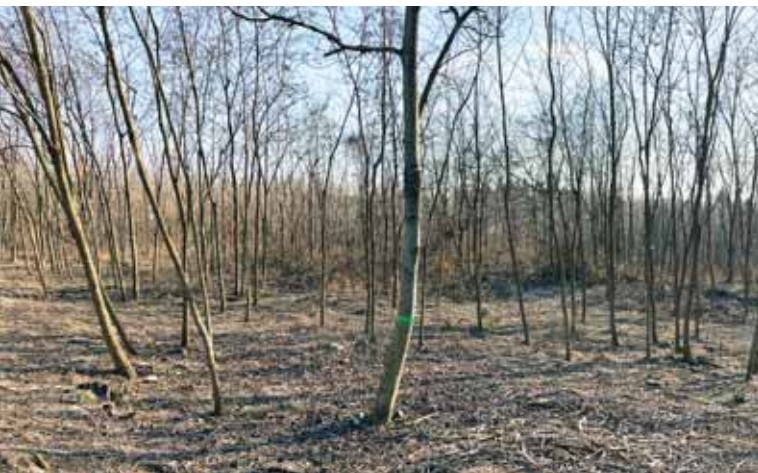
Az erdők fenntartásában jelentős szerepet játszanak az ökológiai szempontok

Felelősséggel a szadai erdőkért című sorozatunkban bemutatjuk, milyen intézkedésekkel, megoldásokkal lehet helyi szinten is fenntarthatóvá, megőrizhetővé tenni a települést övező erdőket. Ezúttal az aranyhegyi kiserdőben történő változásokról írunk.