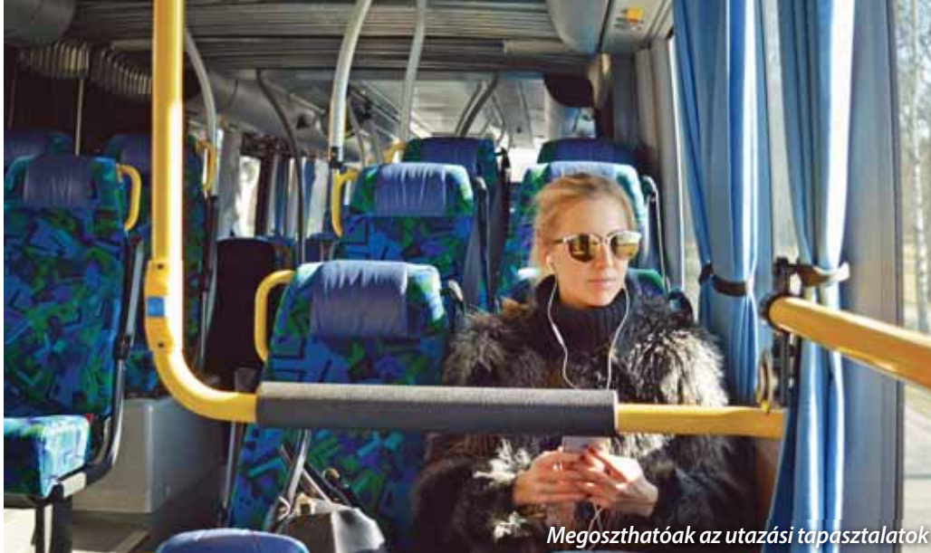
Megoszthatóak az utazási tapasztalatok

attól, hogy milyen utazási módot vesznek igénybe. Hányan használnak rendszeresen autót, aki busszal közlekedik, az jellemzően hova utazik, mit gondol a lakosság a mostani Volánbusz-járatokról – ezeknek mind-mind jelentősége van. A felmérés elsősorban egy online kérdőív keretében valósul meg, de a tervek között szerepel megállóhelyi utasszámlálás és kikérdezés is, hogy a lehető legpontosabb képet kaphassuk meg – sorolta az eddigi „következményeket”.