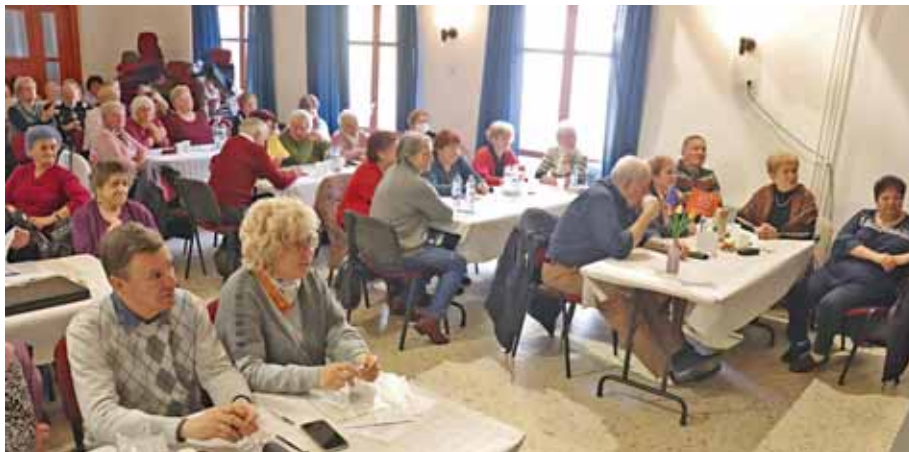
Igazából csak győztesek voltak