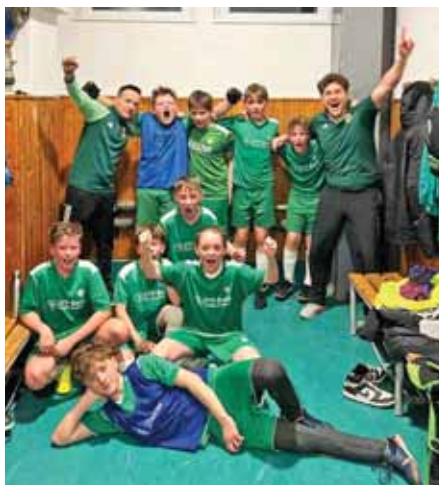
Jogosan ünnepeltek az ifjú focisták

A Szadai SE utánpótlás focistái remekeltek a futsalszezonban, míg a felnőttek jó rajtot vettek a bajnokságban.