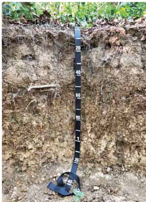
Egy jó talajszelvény igazán informatív