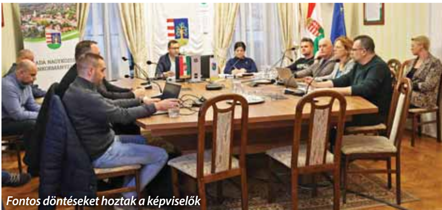
Fontos döntéseket hoztak a képviselők

A szadai képviselő-testület 2025. február 26-án megtartott rendes tanácskozásán a pénzügyi vonatkozású döntések mellett elfogadta, hogy a szadai erdők közjóléti rendeltetésűek legyenek.