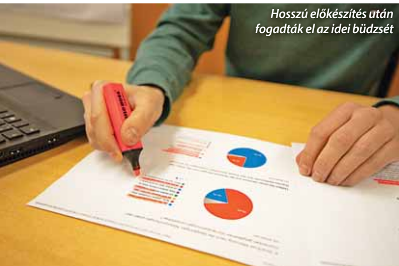
Hosszú előkészítés után fogadták el az idei büdzsét

A február 12-én megtartott rendkívüli testületi ülésen több pénzügyi döntés is született, a legfontosabb ezek közül a település 2025. évi költségvetésének elfogadása volt.