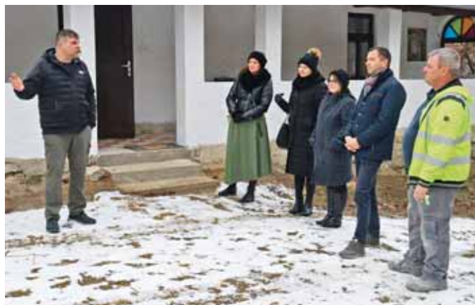
Hamarosan a nagyközönség előtt is megnyílik a ház

Lassan befejeződik a Székelykert melletti új, a jövőben kulturális célokat szolgáló régi parasztház felújítása, végső el- és berendezése, majd következhet a hivatalos megnyitó is.