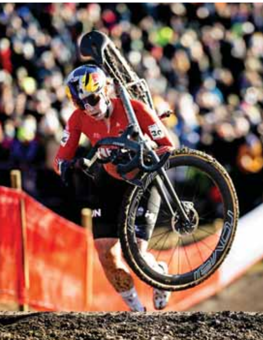
Nehéz terep volt Liévinben

A zárás után egyből indulhatott is a franciaországi Liévinbe, ahol február 1-én a terepkerékpáros-világbajnokság női egyéni számát rendezték. A Cyclingnews szakportál a favoritok közé sorolta a 23 éves magyar bringást.