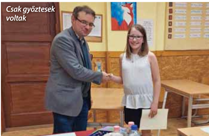
Csak győztesek voltak

Az idén is megrendeztük az immár hagyományosnak mondható Kazinczy szépkiejtési és szépolvasási versenyt az iskolában. Erre minden esztendőben a magyar kultúra napja után kerül sor, ezzel is tisztelegve anyanyelvi kultúránk előtt.