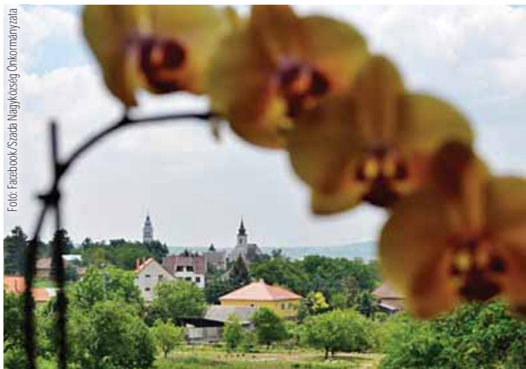
Évszázadok óta lakják ezt a vidéket