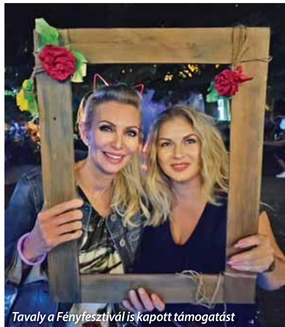
Tavaly a Fényfesztivál is kapott támogatást

Fontos, hogy az érvényesen beadott pályázat nem jelenti automatikusan a kért támogatási összeg elnyerését! A kérelmeket a szadai képviselő-testület tagjai meghatározott szempontrendszer alapján értékelik, és az összpontszámok átlaga alapján kialakult sorrendnek megfelelően támogatják egy adott összeggel a helyezetteket. A támogatások összegéről a testület saját hatáskörében, várhatóan márciusban dönt.