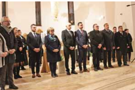
Együtt imádkoztak a felekezetek

Az idén január 19. és 26. között országszerte minden este együtt imádkozhattak a különböző keresztény felekezetek tagjai, érdeklődői az ökumenikus imahét keretében. Bár rövidített időtartamban, de Szadán is volt erre lehetőség.