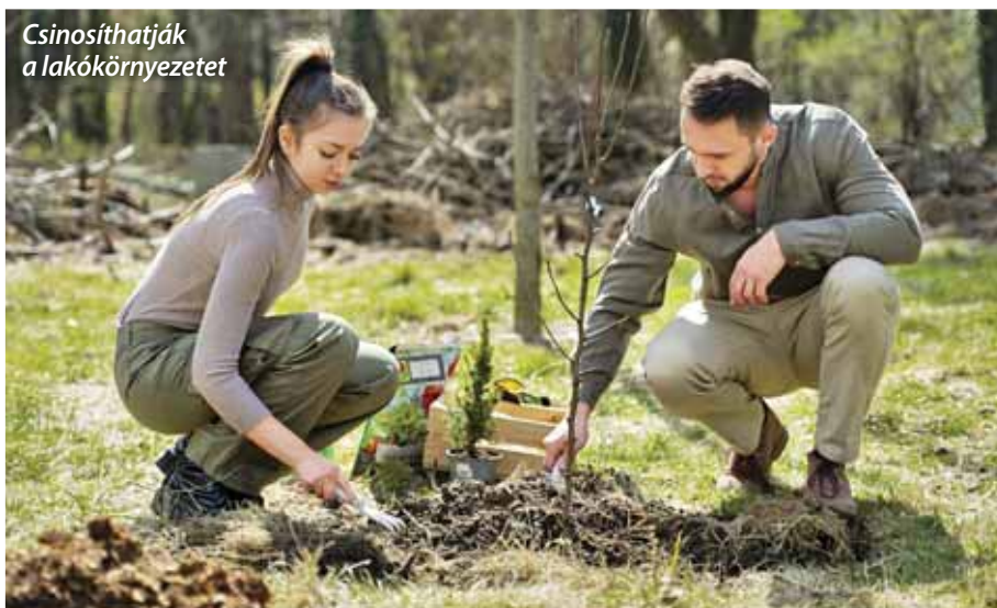
Csinosíthatják a lakókörnyezetet

Jelentkezni a kitöltött jelentkezési lap benyújtásával lehet személyesen a Szadai