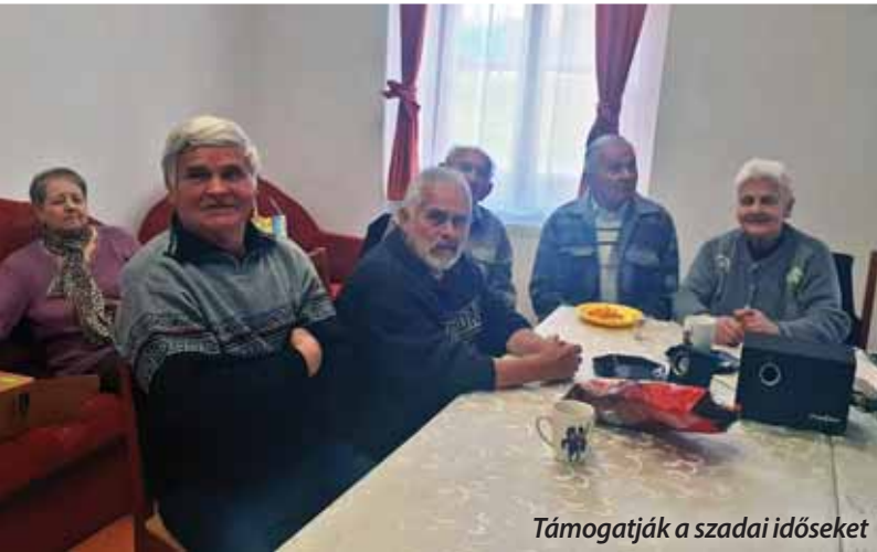
Támogatják a szadai időseket

A mindennapi élet szempontjából kevésbé meghatározó, ám igen szimbolikus jelentőségű rendeletet alkotott a szadai képviselő-testület tavaly decemberben. Az ifjú és idős polgárok is számíthatnak a megbecsülésre.