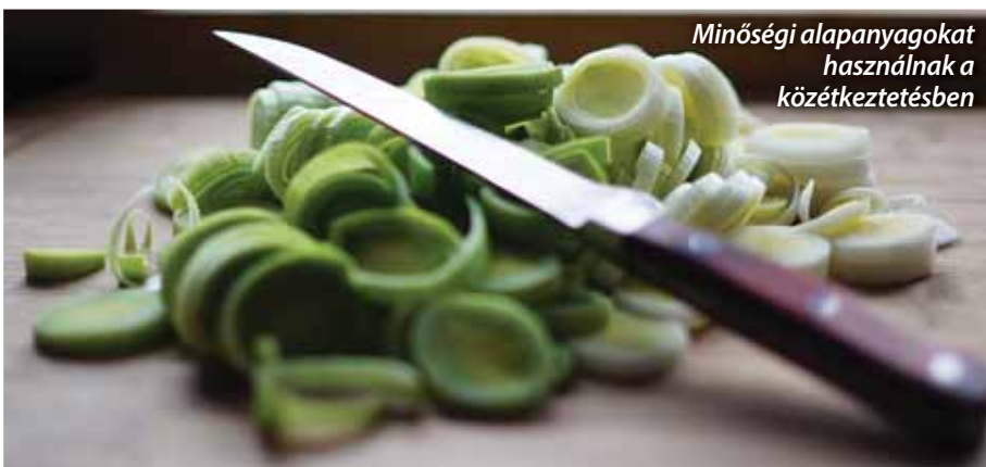
Minőségi alapanyagokat használnak a közétkeztetésben

Tavaly szeptemberben indított sorozatunkban a helyi intézmények részidős helyzetértékeléseit közöljük. A jelen önkormányzati periódus záróéve kapcsán készült összegzők sorát a Szadai Gyermekélelmezési és Szociális Étkeztetési Konyhával zárjuk.