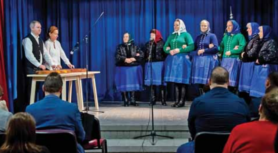
A népdalkör nagy tapsot kapott