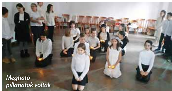
Megható pillanatok voltak

Regisztrálni a www.szada.munipolis.hu/regisztracio címen is lehet a MUNIPOLIS rendszerén keresztül. A honlapon keresztül történő regisztráció során meghatározhatja, hogy milyen információk érdeklí, és kiválaszthatja a megfelelő csoportokat. A regisztráció módjától függetlenül ajánljuk, hogy adja meg telefonszámát és lakóhelyét, hogy váratlan eseményről (pl. balesetek, útlezárások) gyorsan értesülhessen.