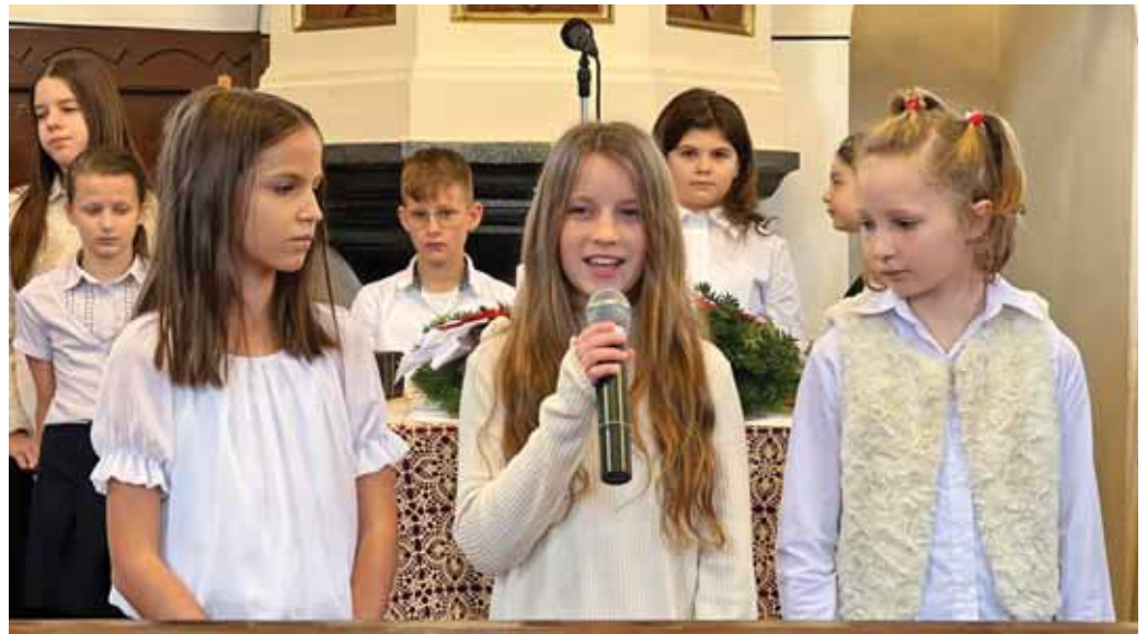
Az adventről is megemlékeztek a tanulók