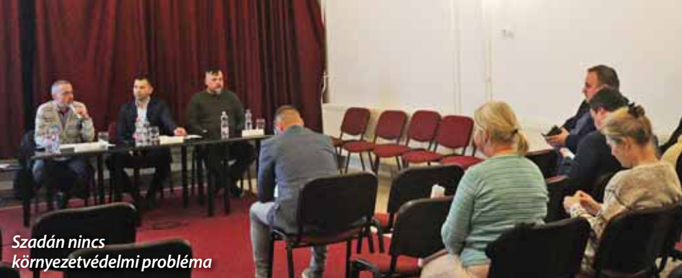
Szadán nincs környezetvédelmi probléma