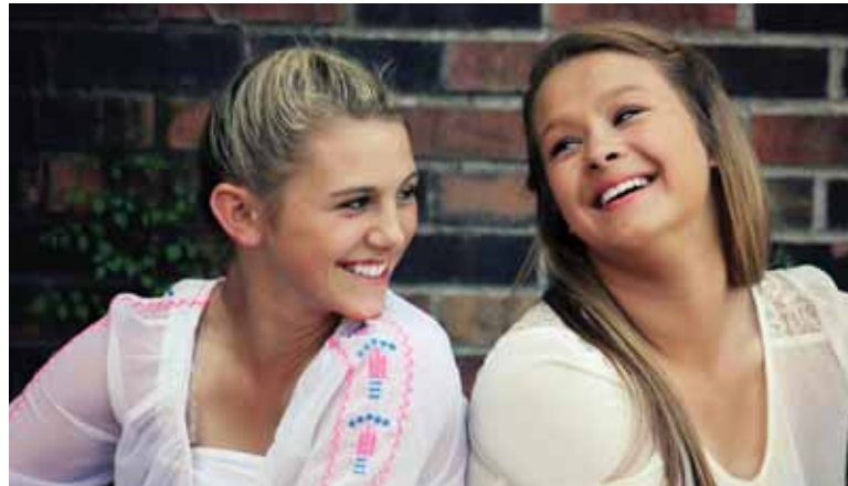
Az önbizalom minden életszakaszban fontos lesz

Az egyik kisfilmben férfi és női szépségideálok szerepeltek az 1910-estől a 2010-es évekig. Ránézésre azt hínénk, hogy visszafogottabbak lettek a szépségideálok az idő haladtával, ám ez nem igaz. Általános tanulság: mindenki öltözködjön úgy, ahogy akar, a társadalomnak ne legyenek ilyen irányú elvárásai. Felhív-