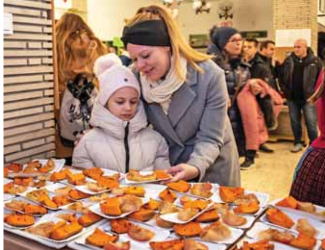
Finomságokkal várták a résztvevőket