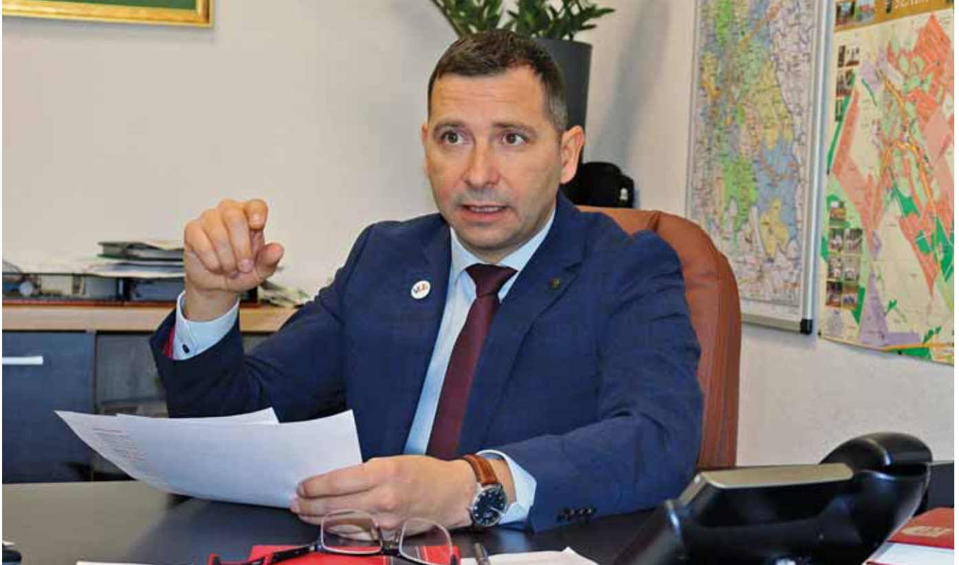
Pintér Lajos szerint a takarékos gazdálkodás hosszú távon előnyös

gedélyek után ezt hamarosan már át is adhatjuk. A Teleki Sámuel utca és a Fenyvesligeti út közötti önkormányzati ingatlanon erdős esőkert kialakítását kezdtük el 2023. októberben, és ennek részeként novemberben a Székely Bertalan út alá egy csapadékelvezető cső is került. A beruházás befejezése után már nem önti el a csapadékvíz a közeli ingatlanokat, a Székely Bertalan úton nem okoz balesetveszélyes átfolyásokat, a vízmegtartással pedig kiegyensúlyozottabb lesz a település vízháztartása. A tervezést indítottuk el 2023-ban, idén tavasszal pedig a veregyházi önkormányzattal közösen elkezdjük a két települést összekötő 740 méteres, kerékpárutat is magában foglaló járdaszakasz kivitelezését.