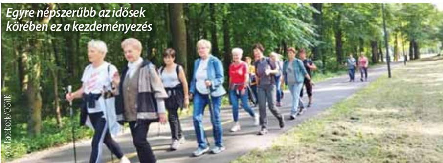
Egyre népszerűbb az idősek körében ez a kezdeményezés

A Szadai Szociális Alapszolgálati Központ Idősek Nappali Klubja is csatlakozott az Országos Gyalogló Idősklub-hálózathoz.