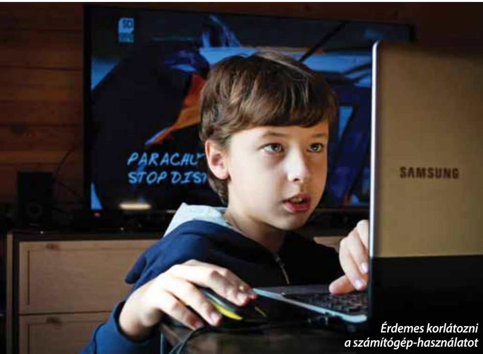
Érdemes korlátozni a számítógép-használatot