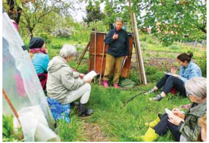
Sokan keresik fel a közösségi kertet

További részletek a biokutatás.hu weboldalon olvashatók.