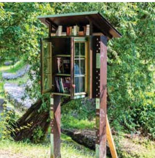
Igazi mestermunka a könyvszekrény

Egy remek kulturális kezdeményezés nyomán bárki bármikor vihet könyvet a Mélyárok sétányon elhelyezett könyvszekrényből, és persze hozhat is ide jónak és értékesnek tartott kötetet.