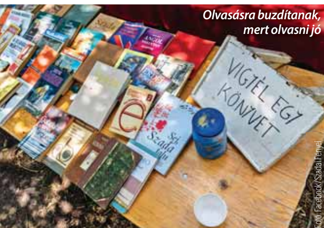
Olvasásra buzdítanak, mert olvasni jó

A júniusi változékony időjárás többször megviccelte a település szabadtéri rendezvényeit. Így volt ez a június 9-én és 10-én megrendezett Szadai Könyvünneppel, a Patak-Party Könyvmegálló avatójával és a családi mesedélután Székely-kertben tervezett előadásaival. Az eső miatt a könyvtári piknik könyvvásárra elmaradt, és a papírszínházi meseelőadásokat is a könyvtár falain belül tartottuk meg.