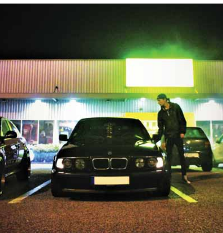
Minden pillanatban figyelni kell a tolvajokra

Különösen fondorlatos módon fosztják ki külföldön az autót bérlő turistákat. A CLB biztosítási alkusz szakértője azt javasolja, ha a helyszínen nincs lehetőség rendőrségi feljelentést tenni, akkor azt itthon pótolni kell, a biztosítók ugyanis csak így fizetnek kártérítést.