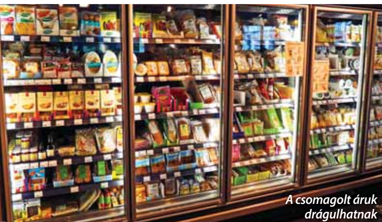
A csomagolt áruk drágulhatnak

Jelentősen növelheti az élelmiszerárakat a hulladékgazdálkodási rendszer júliusi átalakítása a Felelős Élelmiszergyártók Szövetsége szerint. Egy új díjtétel összege a bolti eladási árakba épülhet be.