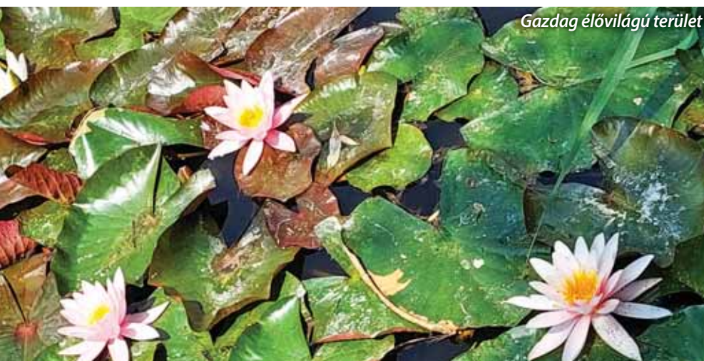
Gazdag élővilágú terület