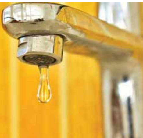
Javulhat az ellátásbiztonság

Éppen a tavalyi aszályos időszak világított rá arra, hogy az ivóvíz esetleges hiánya mennyire közvetlenül és mennyire súlyosan érinti a lakosságot. Nem véletlen, hogy a DMRV számára a korábban elnyert támogatás összegét – a tavalyi szárazságra és ellátási problémákra tekintettel – az idén tovább emelték, mert indokoltta vált egy új, a „Solymár csúcsidei vízellátásának fejlesztése, új expressz vezeték kiépítése” megnevezésű projektem beemelése a tervzetbe abból a célból, hogy a jövőben előálló hasonló időjárási viszonyok esetén is fenn tudják tartani az ellátásbiztonságot a Pilisvörösvári kistérség területén. AP