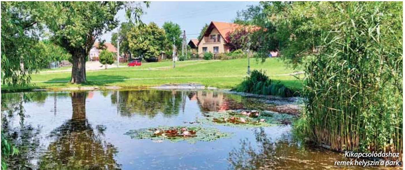
Kikapcsolódáshoz remek helyszín a park