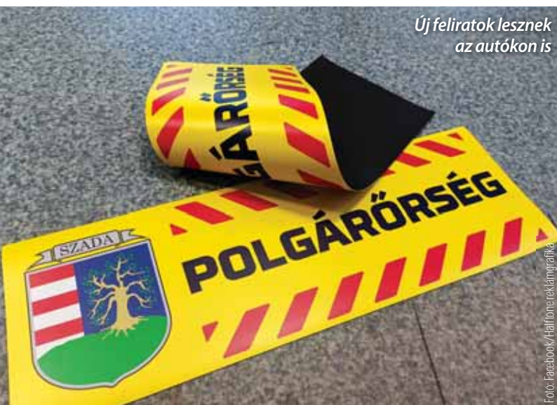
Új feliratok lesznek az autókon is

Szada Nagyközség Önkormányzat képviselő-testülete 2023. június 22-én rendes testületi ülést tartott, amelyen döntés született többek között a házasságkötés új díjtételeiről, a Szadáért Polgárőr Egyesületnek térítésmentesen biztosított ingatlanhasználatról is.