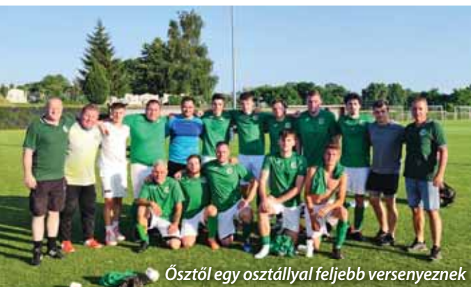
Ősztől egy osztállyal feljebb versenyeznek

Ha egy szóban lehetne összefoglalni a szadai felnőtt labdarúgócsapat 2022/23-as szereplését, talán a legjobb kifejezés erre a „hullámvasút”.