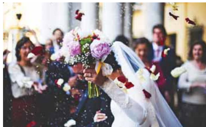
Drágább lett a hivatalon kívüli esküvő

Az önkormányzat aktuális költségvetési és vagyoni helyzetét megvizsgálva kiderült, hogy