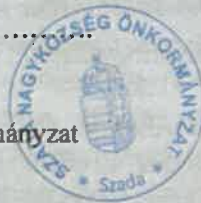
Boros Gábor ügyvezető