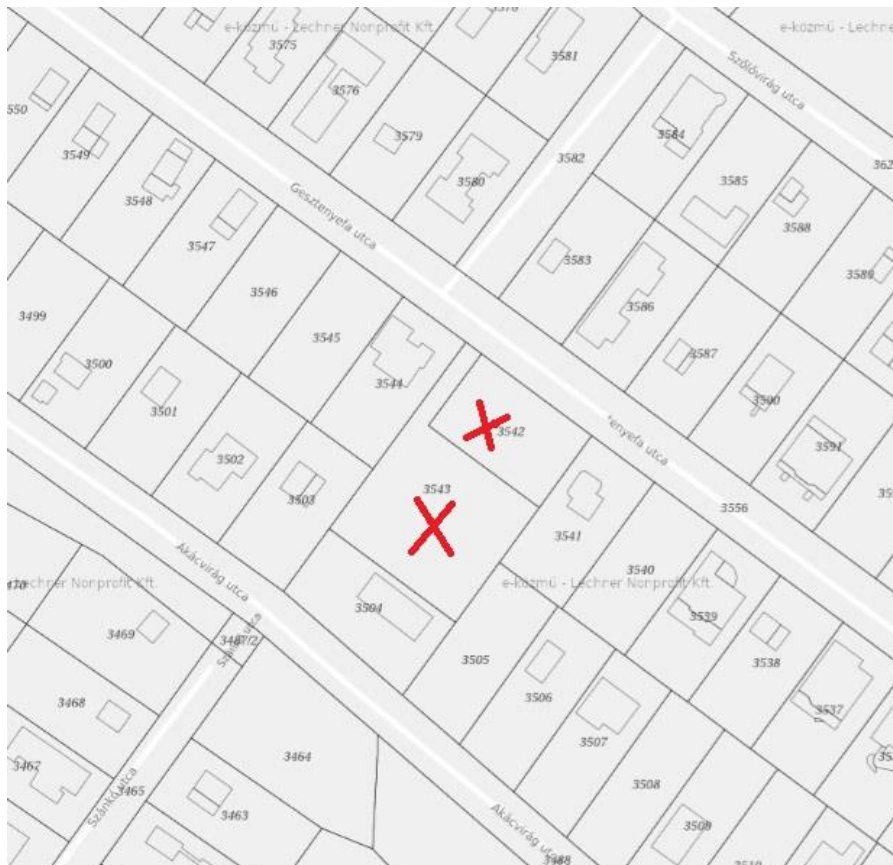
1. ábra: Jelenlegi állapot

A 2024. évben, összesen 2 alkalommal is meghirdetett ingatlanértékesítési pályázati felhívás eredménytelenül zárulása okán, felmerült annak a lehetősége, hogy telekhatár-rendezéssel a 3542 és 3543 hrsz-ú ingatlanokat közel azonos méretű és fekvésű ingatlanokká lehetne alakítani, amelynek megtörténését követően a 2 ingatlan külön-külön is értékesíthetővé válhatna, amivel a jelenleginél szélesebb vevőkör válna elérhetővé.